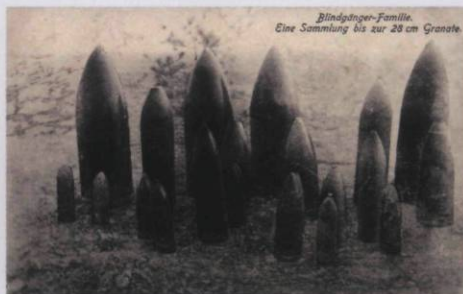
Bündinger-Familie. Eine Sammlung bis zur 28 cm Granate.