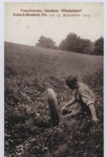
Französisches Geschoss (Bildgänger) Eckkirch-Markirch Ebn. am 29. September 1914.