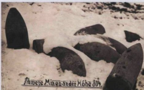
Finvere Mine bei Höhe 304.