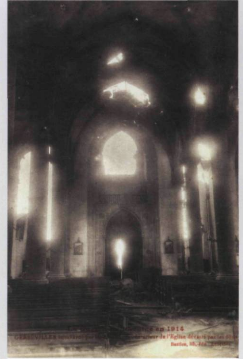
1914 GERSQUILLER ... ... de l'Eglise ... ...