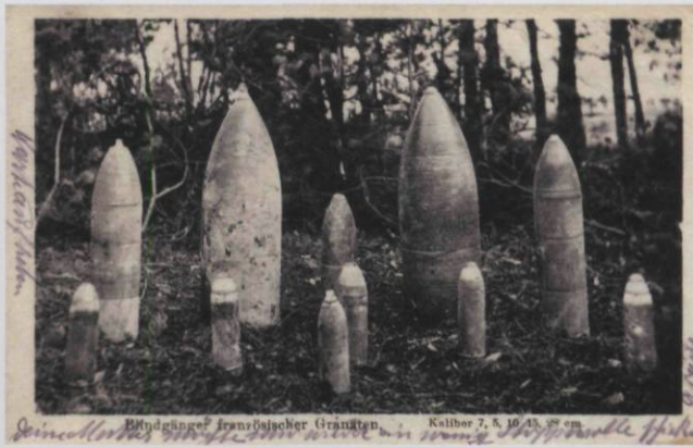
Blindgänger französischer Granäten Kaliber 7, 8, 10, 15, 20 cm Gezeichnet von ... in ...