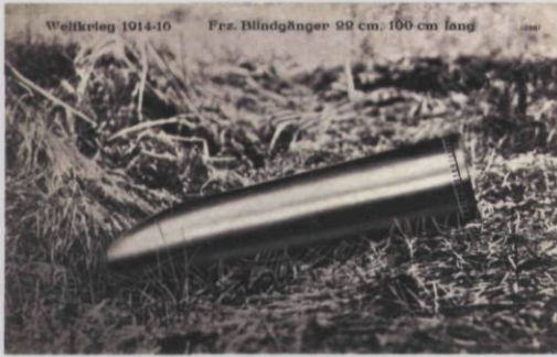
Weltkrieg 1914-16 Frz. Blindgänger 90 cm, 100 cm lang