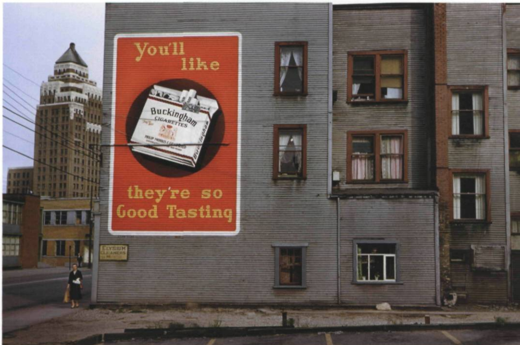
Elysium Cleaners, 1958