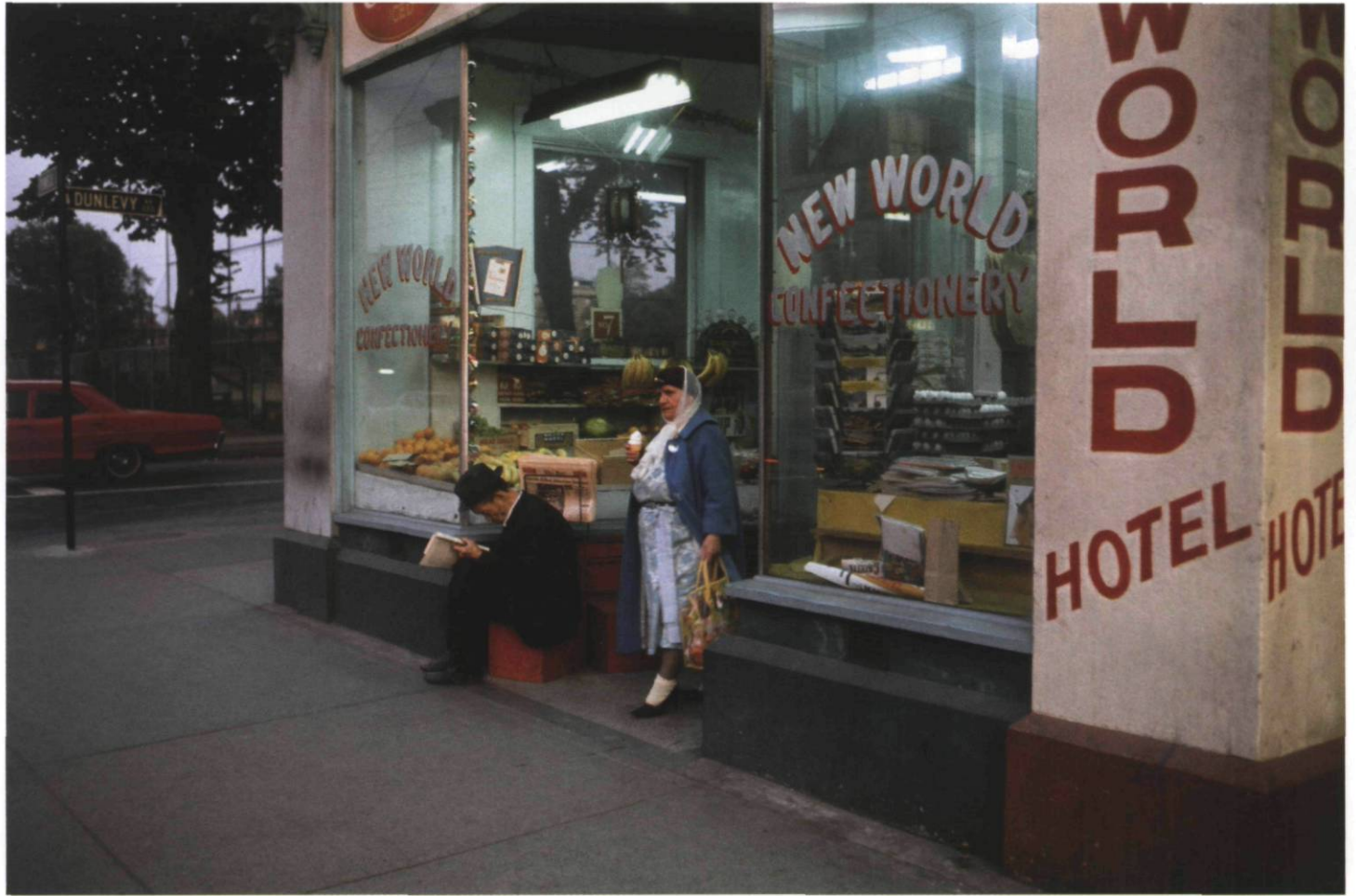
New World Confectionery, 1965

For more than fifty years, Fred Herzog has roamed the streets of Vancouver. His camera dwells on the raw fabric of the city: second-hand stores, restaurants, storefront windows, barbershops, and vacant lots, and the people using those spaces. The selection of images presented here stems from a body of work that comprises hundreds of images. All of these works share a bold and innovative use of colour and attest to the artist's interest in human interactions within mutating cityscapes.