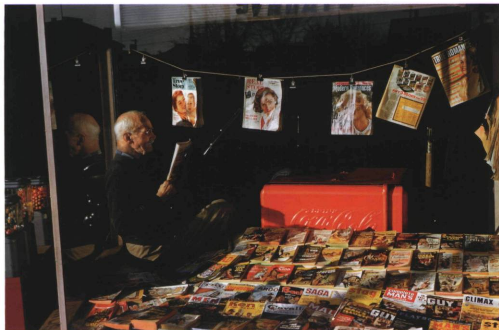
Magazine Man, 1959