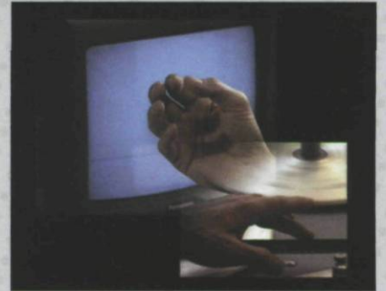
Deep Play , 2007 12-channel video installation / installation vidéo à 12 écrans 2h15min.