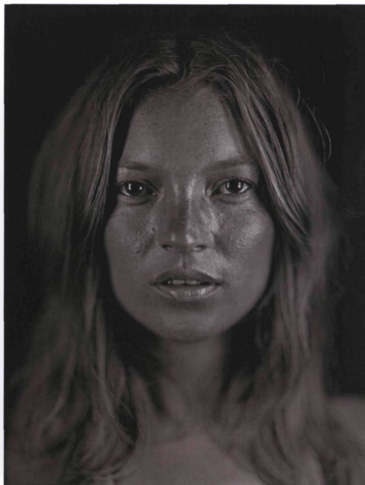
Chuck Close Kate #14, 2005 55,88 x 43,18 cm