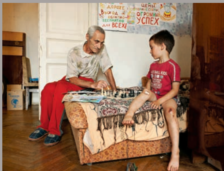
Chess with Grandson, 2011, épreuve chromogénique, 100 x 134 cm

Dans cette exposition, Hannah poursuit sa série des Stills , son corpus de travail le plus important, dans laquelle il s'intéresse à ce qui subsiste de la vidéo lorsqu'elle est dépourvue de son et de mouvement. Il en