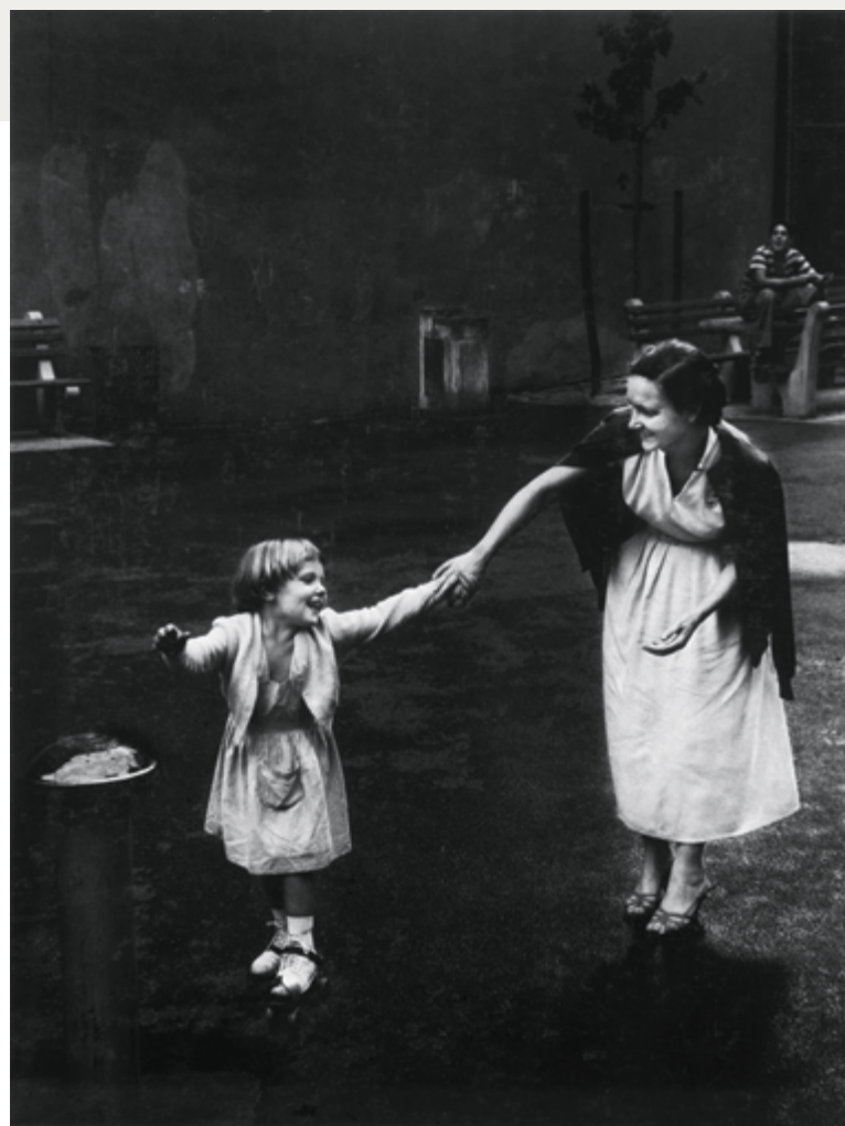
Greenwich Village, New York, 1957 , épreuve argentique / gelatin silver print, 32 × 24 cm, don de / gift of The Hall Family Foundation, au / to the Nelson-Atkins Museum of Art (Kansas City, Missouri)

album. At the same time, Heath began to make snapshots produced with a Polaroid SX 70, which enabled him to capture moments of pure encounter – the spontaneity and friendliness of the gesture – in the colour palette specific to this technique. Found images, snapshots, advertisements, articles, collages, autobiographical