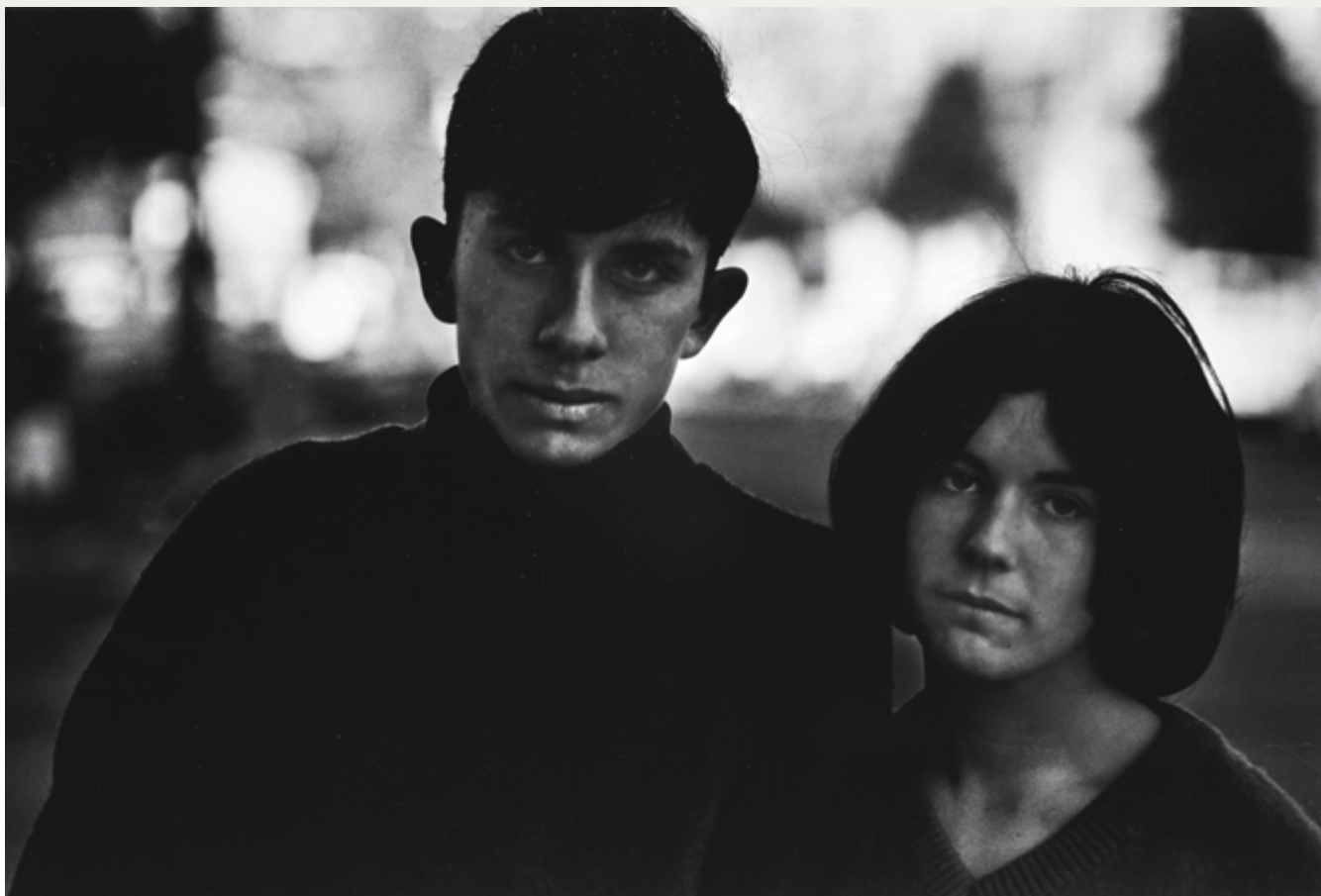
Santa Barbara, California, 1964, épreuve argentique / gelatin silver print, 13 × 19 cm, don de / gift of The Hall Family Foundation, au / to the Nelson-Atkins Museum of Art (Kansas City, Missouri)

visages, magnifie leur expressivité et, ce faisant, installe ses sujets non plus dans l'espace public, mais dans le domaine de la pure présence. En bout de parcours, les visages existent dans un temps et un espace qui sont ceux de la fixité et de la densité de l'image, résultat des interventions successives du photographe sur la matière photographique et du rendu expressif du tirage qui tient de l'épure.