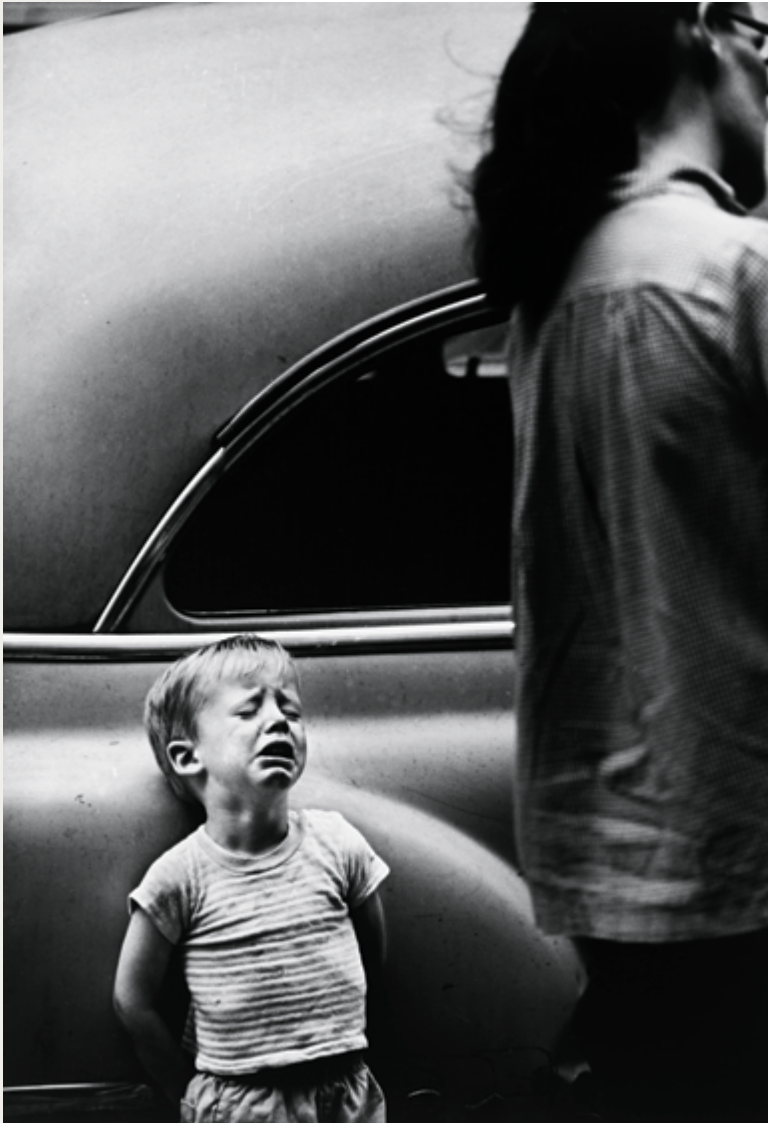
New York, 1962, épreuve argentique / gelatin silver print, 28 x 22 cm, don de / gift of The Hall Family Foundation, au / to the Nelson-Atkins Museum of Art (Kansas City, Missouri)

« Identité » est entendu ici, non pas au sens réducteur de repli sur soi et sur une poignée de valeurs communes comme on l'entend souvent actuellement, mais comme ouverture à l'irréductibilité de l'Autre qui fonde la singularité de la personne. Ce va-et-vient entre identité et altérité cristallise la rencontre dans l'instant de la prise de vue du photographe avec le visage qui s'offre dans sa nudité et sa proximité comme présence vivante.