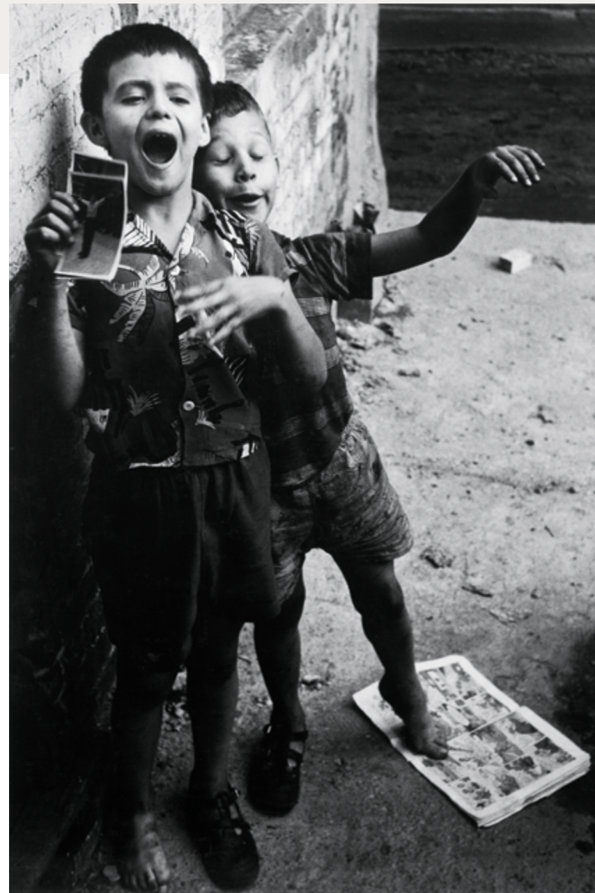
Washington Square, New York, 1958, épreuve argentique / gelatin silver print, 32 × 21 cm ; Chicago, 1956, épreuve argentique / gelatin silver print, 32 × 22 cm, don de / gift of The Hall Family Foundation, au / to the Nelson-Atkins Museum of Art (Kansas City, Missouri)

Multitude, solitude. Les photographies de Dave Heath 2 est celui du visage. Dans un grand nombre des quatre-vingt-deux photographies assemblées en dix chapitres qui résument sa production des années 1952 à 1963, Heath isole et scrute des visages sur lesquels se lit la rencontre de deux singularités, celle du photographe et celle de ses sujets qui se reconnaissent dans la vulnérabilité d'un face à face silencieux. Dans cette perspective, les idées du philosophe Emmanuel Levinas pourraient constituer la clef de voûte de la recherche d'humanité de Heath : « Le visage n'est pas l'assemblage d'un nez, d'un front, d'yeux, etc., il est tout cela certes, mais prend la signification d'un visage par la dimension nouvelle qu'il ouvre dans la perception d'un être. Par le visage, l'être n'est pas seulement enfermé dans sa forme et offert à la main – il est ouvert, s'installe en profondeur et, dans cette ouverture, se présente en quelque manière personnellement. Le visage est un mode irréductible selon lequel l'être peut se présenter dans son identité 3 . »