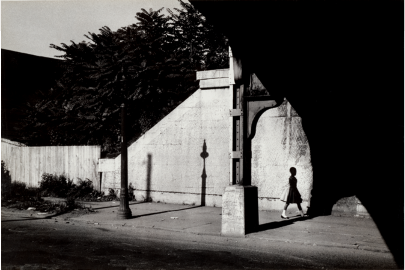
Rochester, New York, 1958, épreuve argentique / gelatin silver print, 17 × 25 cm, don de / gift of Hallmark Cards, Inc., au / to the Nelson-Atkins Museum of Art (Kansas City, Missouri)

l'artiste en 2016. C'est là comme une synthèse de tous les registres expressifs adoptés tour à tour par Heath, produisant au fil de son élaboration « une chronique au long cours qui traduit [son] engagement envers le monde 8 . »