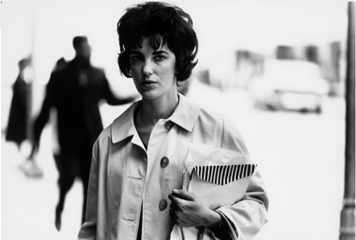
Kansas City, Missouri, 1967, épreuve argentique / gelatin silver print, 19 × 27 cm, don de / gift of The Hall Family Foundation, au / to the Nelson-Atkins Museum of Art (Kansas City, Missouri)

A Dialogue with Solitude . Chaque image y est savamment construite et représente un instant suspendu dans la totalité d'un temps et d'un espace purement photographiques qui forment un énoncé cohérent. Mais leur mise en relation dans l'ensemble mouvant qu'est une séquence les inscrit dans une temporalité qui n'est plus celle d'une suite linéaire d'événements qui décriraient un arc narratif aboutissant à un dénouement, ni celle des liens de causalité qui établiraient une suite logique, mais celle d'un livre composé d'entrelacements, de résonances et de ruptures qui se font et se défont au fil du parcours dans les climats émotionnels saturant chacune des images. Ce sont là autant de balises dans un cheminement intérieur visant à mettre en lumière, dans ce temps discontinu et dans cet espace fracturé, la tentative de leur auteur de se rattacher à sa propre humanité dans le regard de l'autre ; autant d'images miroir des états d'âme de Heath et de sa démarche d'incarnation qui permet de transcender le particulier pour atteindre à l'universel au sein de l'individu.