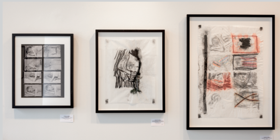
Vue partielle de l'exposition