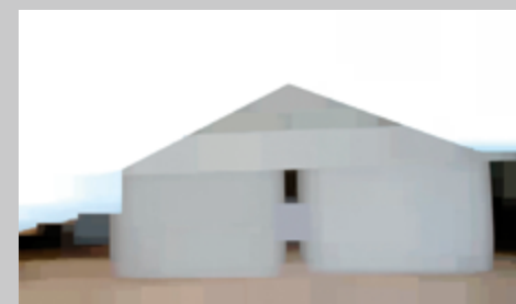
a barn at north fork, 2010, vidéo numérique HD, vidéographie, couleur, son, 24 min, en boucle permission de l'artiste et de la Cristin Tierney Gallery