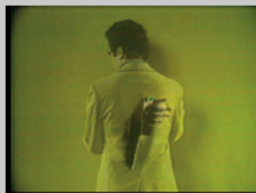
R-G-B, 1974, vidéo couleur, son, 11 min 30 s ; Set of Coincidence, 1974, vidéo couleur, son, 13 min 24 s ; Three Transitions, 1973, vidéo couleur, son, 4 min 53 s, permission de la Cristin Tierney Gallery

Or, une dimension plus existentielle, que la spatialité radicale des premiers travaux avait jusque-là occultée, va se faire jour. L'importance donnée au visage dès les premières œuvres, conduira insensiblement Peter Campus vers une destination imprévue. Tout commence, semble-t-il, au moment où, en gros plan sur un fond quasi métallique, un acteur aux yeux de braise observe une fixité soutenue, concentré qu'il est sur la pensée de sa finitude ( Head of A Man with Death in His Mind , 1977-1978). Cette cruciale méditation se répercute la même année dans un Polaroid en noir et blanc où une mélancolique physionomie se pétrifie en masque grec ( Untitled Woman's Head en 1978) puis avec Untitled (Man's Head) en 1979.