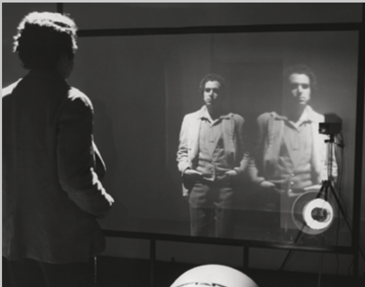
Interface, 1972, installation vidéo en circuit fermé, dimensions variables