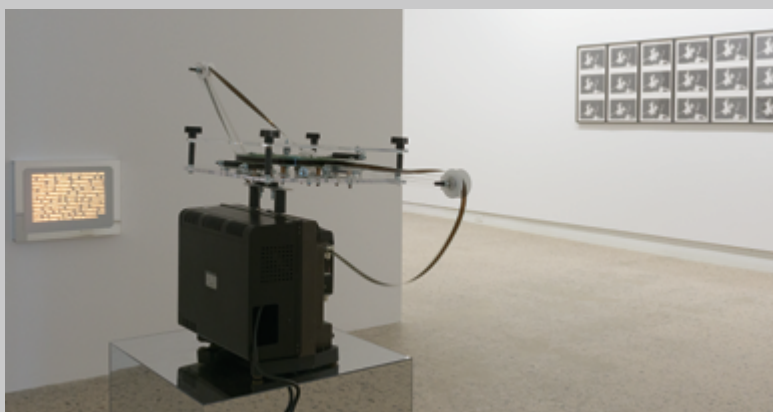
Vue de l'exposition Life Session

Avec Life Session , Nelson Henricks ajoute une pièce intéressante à l'œuvre qu'il élabore depuis près de 30 ans. Par sa façon d'aborder le réel en mêlant analyse, travail formel, subjectivité et humour, et par l'intérêt qu'il accorde aux choses les plus nobles comme les plus triviales, cet artiste se rapproche de l'essayiste. Il acquiescerait sans doute à cette phrase de Montaigne :