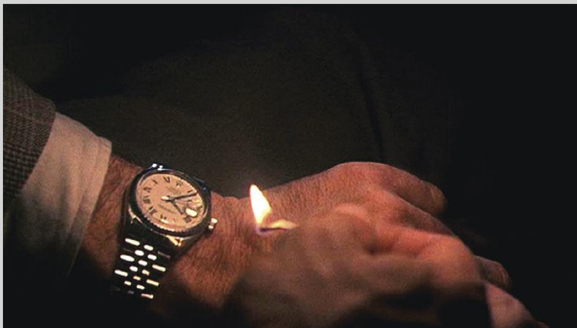
The Clock , 2010, vidéo à canal unique, durée : 24 heures