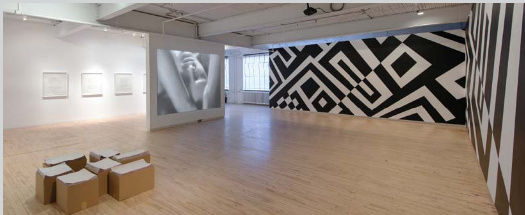
Camoufleurs , installation view, Battat Contemporary, 2014–15, photo: Paul Litherland

This captivating exhibition of new work by Kathleen Ritter is aptly and enticingly titled Camoufleurs . A camoufleur was a person – usually an artist, usually a woman – who designed and installed military camouflage in one of the world wars of the last century. The term relates to all First and Second World War specialists in the art of camouflage.