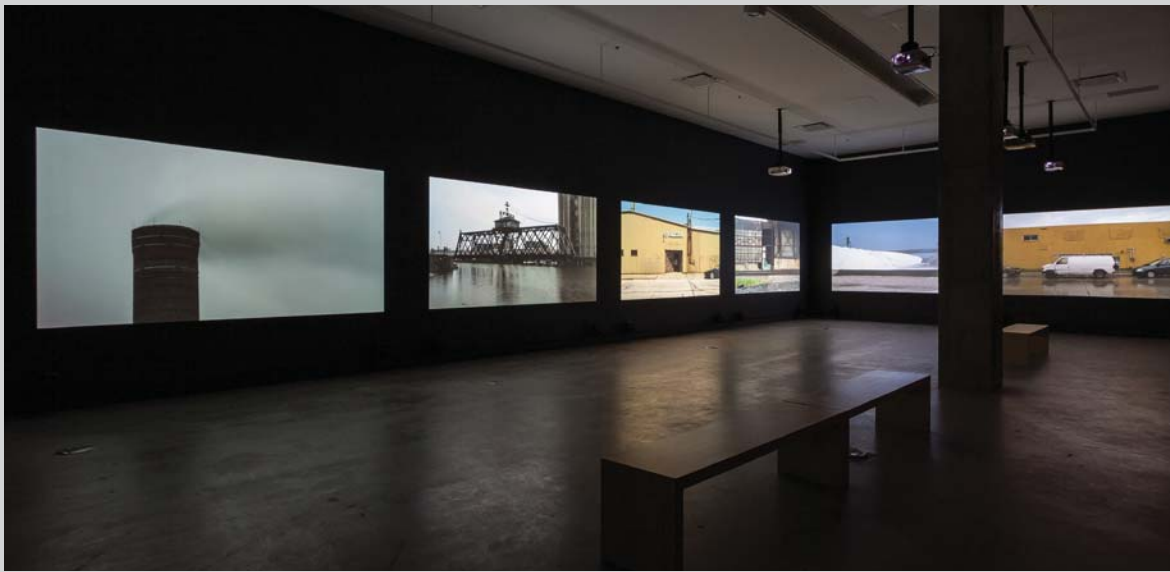
One Way Boogie Woogie 2012, 2012, installation vidéo HD à 6 canaux (couleur et son), vue de l'exposition présentée à VOX

soient distinctes, leur cohabitation incite à faire un lien entre elles.