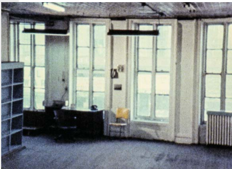
Wavelength , 1967 still image / image fixe, 16 mm film, colour, sound / film 16 mm, couleur, son 45 min

varying sizes that make up the printed halftone image. So, if we were to look at this print with a magnifying glass, we would see the halftone dots within each horizontal scan line.