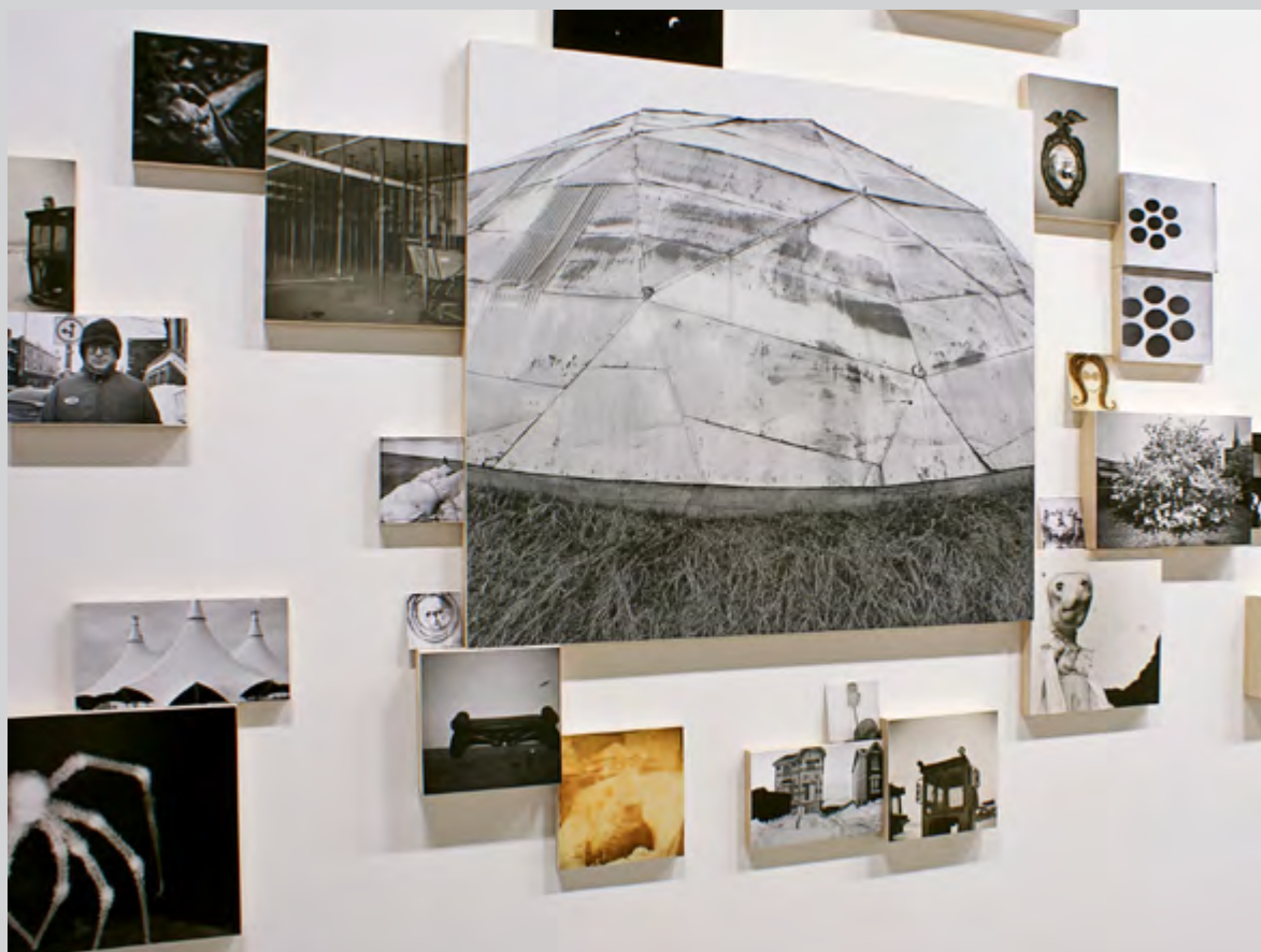
Vues d'exposition de Visites libres , 2013, épreuves argentiques et tirages au jet d'encre