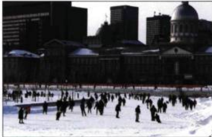
La patinoire du Vieux-Port