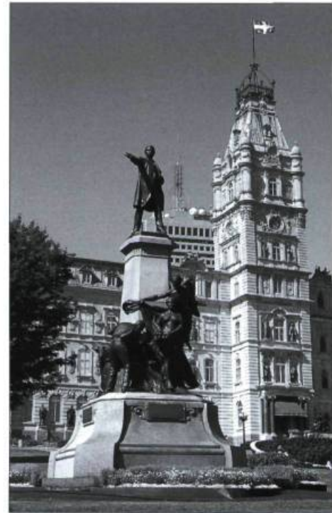
Le monument Honoré-Mercier, devant le parlement de Québec.