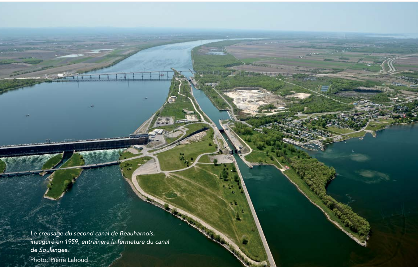
Le creusement du second canal de Beauharnois, inauguré en 1959, entraînera la fermeture du canal de Soulanges.