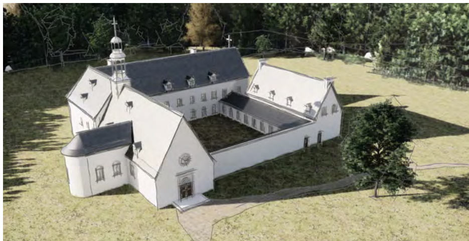
Le mur trouvé à l'intérieur d'un intrigant massif de pierre date de l'occupation des Récollets (1620-1629 ou 1670-1692). Cette illustration représente le monastère au moment où les Augustines y ont emménagé, en 1693. Certains éléments (emplacement et forme du clocher, localisation et dimension des fenêtres, etc.) sont des hypothèses.