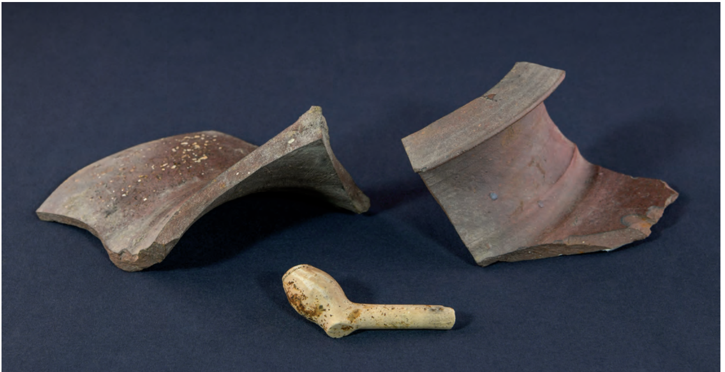
Une pipe, des briques et des fragments d'une jarre en grès grossier de Basse-Normandie, découverts en 2018, constituent les premiers témoins matériels de l'occupation du site par les Récollets entre 1620 et 1629.