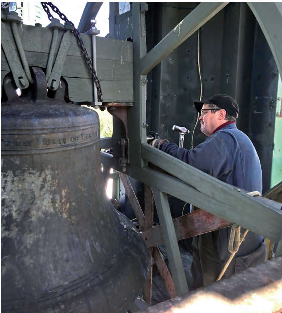
La restauration de la cloche Marguerite-Michel a permis de rendre l'instrument de nouveau fonctionnel.