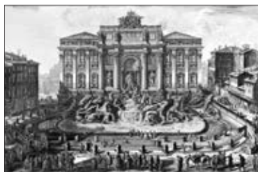
Vue en perspective de la grande fontaine à l'eau vierge... de Giovanni Battista Piranesi

Photo: Nicola-Frank Vachon, Perspective, MCQ, coll. du Séminaire de Québec, 1993.28474