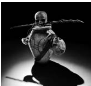
Pwen Ibo, terre cuite, os, bois et tissu

IMG2012-0320-0003-Dm