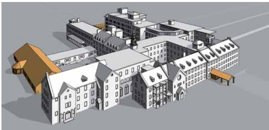
Deux maquettes du même site : monastère des Récollets entre 1671 et 1679 (en haut) et monastère des Augustines de l'Hôpital général de Québec entre 1965 et 2002 (en bas).