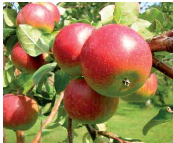
La pomme Fameuse est l’une des plus anciennes et des plus réputées du Québec.

« Chez Ruralys, on voulait revaloriser ces variétés anciennes [de prunes, de pommes, de poires], les répertorier, les sauvegarder et les remettre en circulation », raconte Dominique Lalande. Un colossal travail de repérage a d’abord été effectué pour