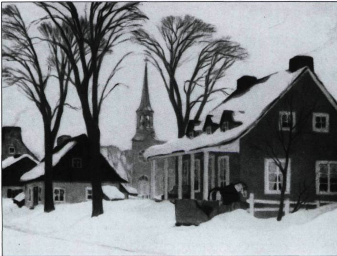
L'hiver à Baie-Saint-Paul. Huile sur toile de Clarence Gagnon (1881-1942).