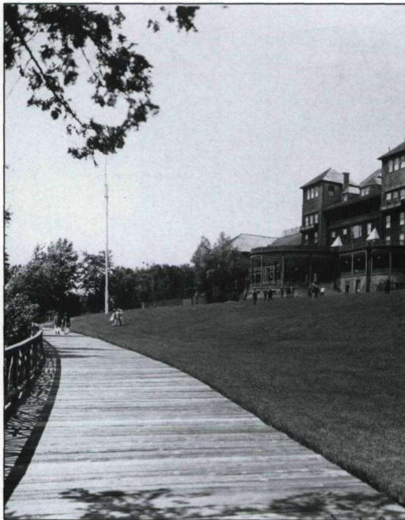
Le premier manoir Richelieu. Cet hôtel luxueux, édifié en 1899, devait être la proie des flammes dans la soirée du 12 septembre 1928. Il sera reconstruit l'année suivante.

Située en périphérie de Québec, Charlevoix connaît aujourd'hui une situation économique et