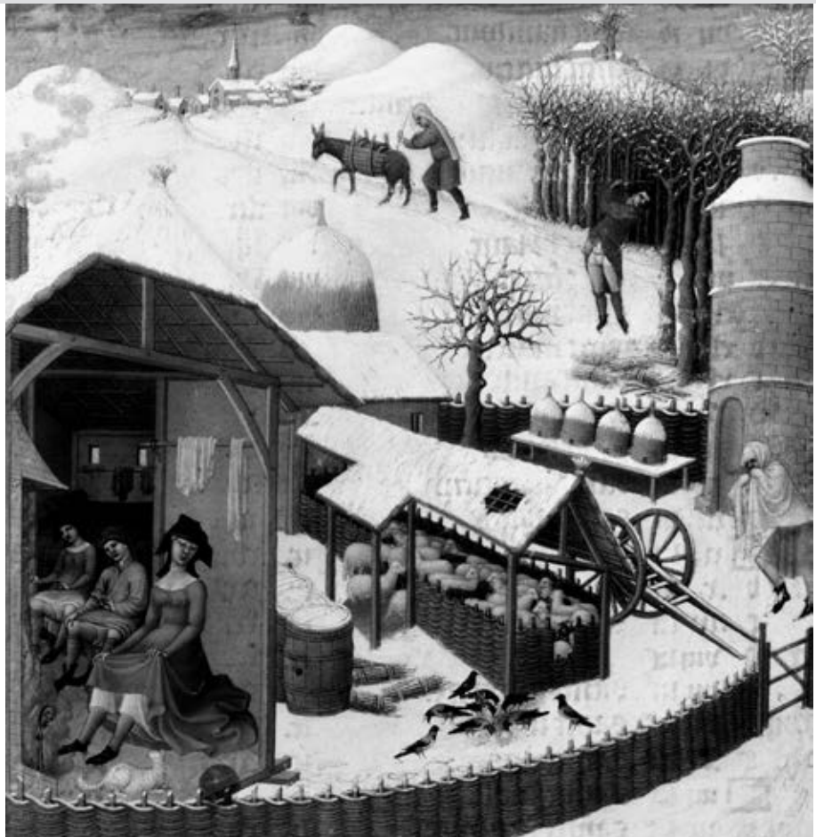
La vie paysanne en hiver, Les Très Riches Heures du duc de Berry . (Musée Condé, Chantilly/Art Resource, New York).

Un portrait détaillé de cet homme qui fut vice-roi de la première colonie française d'Amérique est proposé dans l'ouvrage de Bernard Allaire, La rumeur dorée : Roberval et l'Amérique (2013).