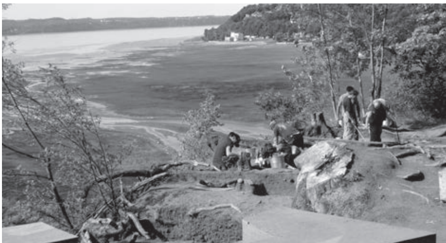
Le site archéologique Cartier-Roberval en cours de fouilles à l'été 2010.

E n 2006, le gouvernement du Québec a confié à la Commission de la capitale nationale du Québec le mandat de réaliser des fouilles archéologiques sur le site qui a vu naître la première colonie française d'Amérique. Sept années de recherche ont permis de documenter comme jamais auparavant cet épisode fondateur de notre histoire. En voici un aperçu.