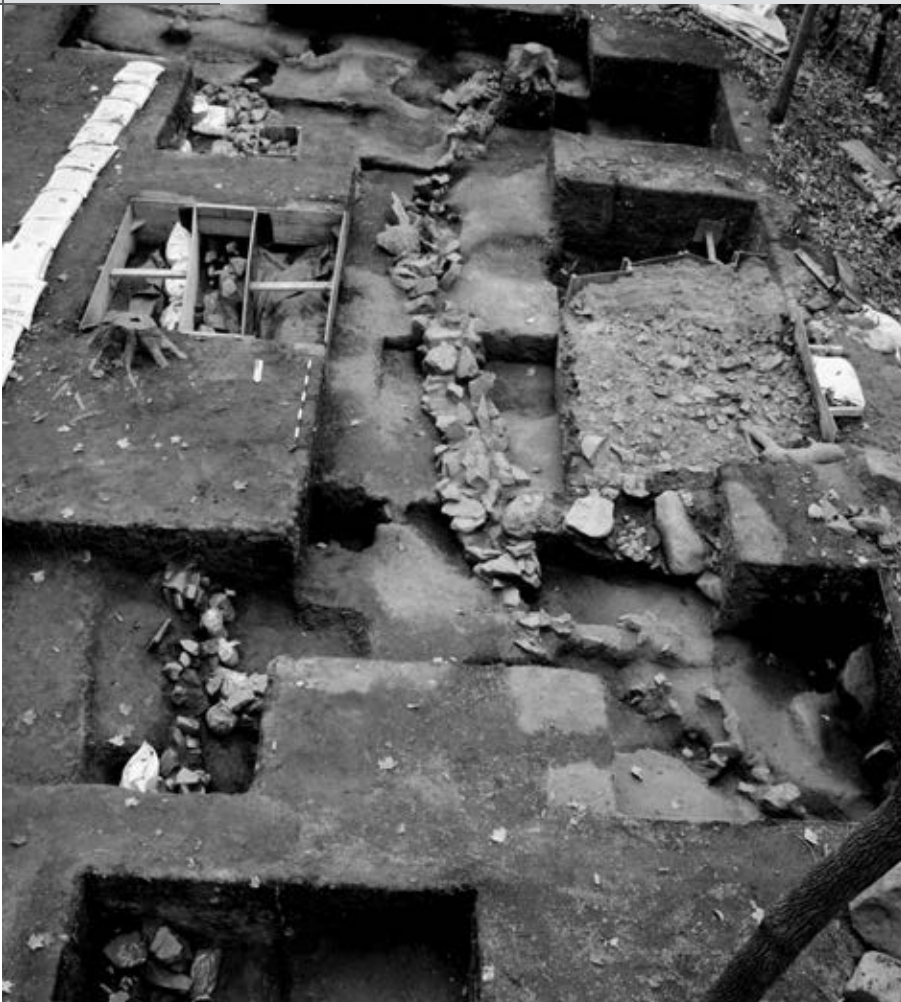
Vestiges d'une courtine ou d'une galerie entre les bâtiments nord et sud du fort d'en haut. (CCNQ).

épaisse couche d'incendie bien démarquée sur le bord des falaises, où s'élevaient trois édifices dont les ruines se sont formées en partie dans les heures qu'a duré la conflagration, puis durant leur recouvrement par la végétation. Nous avons recueilli dans la couche d'incendie un mobilier et des vestiges qui arboraient des liens indéniables avec le territoire français, dont les régions de Louviers, de Saintonge, de Charles-de-Bretagne et de la côte ouest. Parmi les premiers indices, le vitrail trouvé sur l'emplacement du bâtiment sud pourrait témoigner d'une présence aristocratique ou religieuse. D'ailleurs, les autres bâtiments dotés d'une fenestration favorisant la luminosité s'avéraient compatibles avec un contexte aristocratique de la fin du Moyen Âge et du début de la Renaissance. Quant au confort des bâtiments résidentiels, nous pouvons en témoigner par la présence d'un plancher et des traces d'un ameublement.