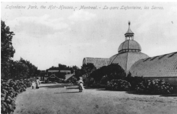
Les serres du parc Lafontaine. Carte postale vers 1910.