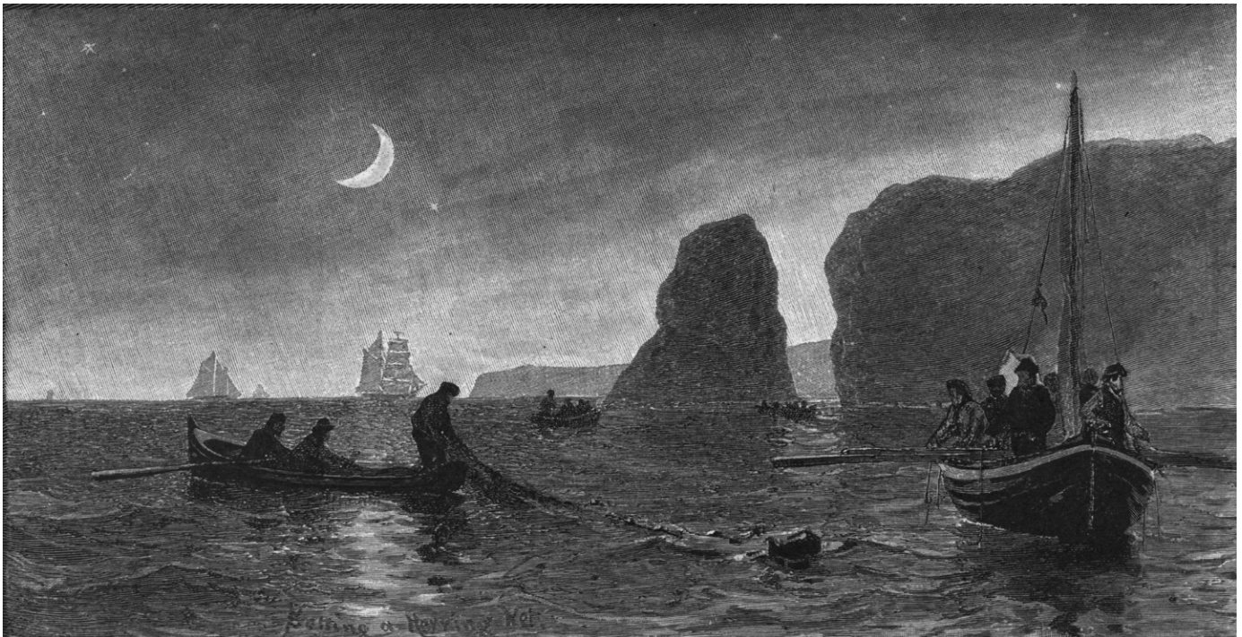
Gravure représentant des pêcheurs relevant des filets remplis d'appâts nécessaires à la pêche à la morue, 1882. (Musée de la Gaspésie. Collection Richard Gauthier. P162/5).