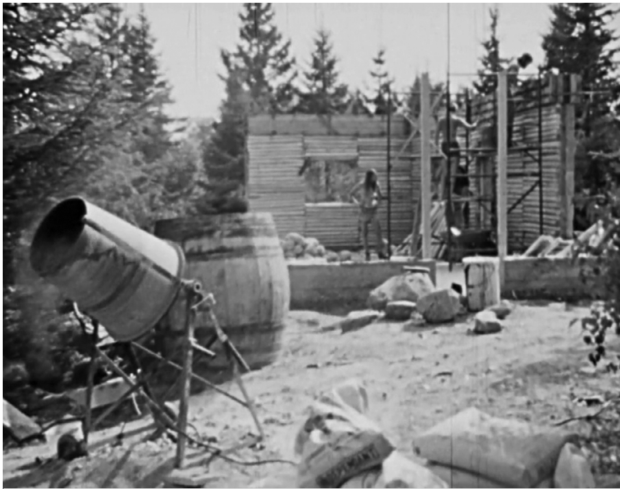
Construction de L'Abri d'Érasme à Sainte-Agathe-des-Monts. (Image tirée du film L'interdit de Pierre Maheu).

ped d'égalité, tous considérés comme des citoyens libres, sujets de volonté comme de désir. En ce sens, réaliser son rêve revenait pour Lemieux à mettre de l'avant les limites de la Révolution tranquille que ce soit en termes de transformation du champ de la santé mentale ou de reconnaissance des droits des personnes atteintes de troubles mentaux (la loi électorale canadienne de 1970 ne leur accordait par exemple toujours pas le droit de vote).