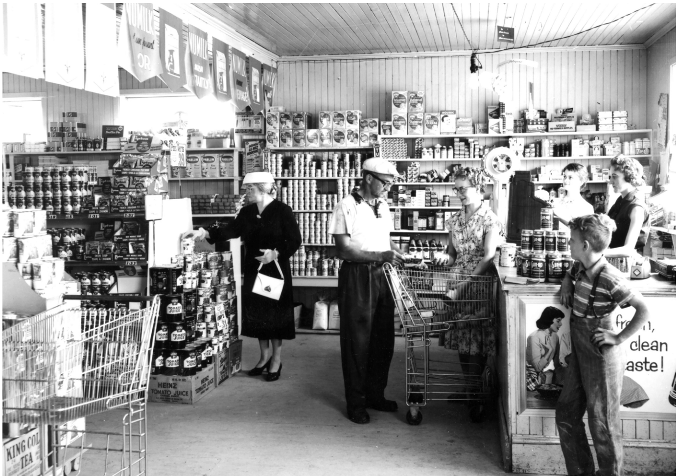
Luceville, 1959. La coopérative de consommation.

où l'accès à la propriété est plus difficile pour la classe moyenne. Ce nouveau modèle a cependant provoqué la scission du mouvement de l'habitation coopérative, traditionnellement dépendant des gouvernements et des programmes de logements sociaux.