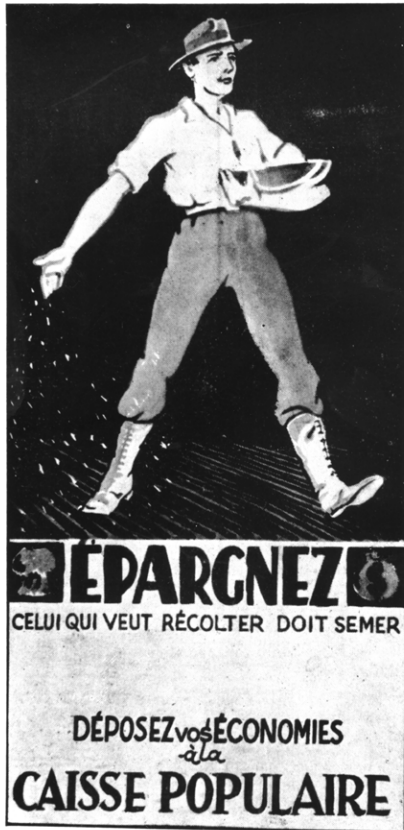
Publicité publiée dans la revue La Caisse populaire Desjardins en 1935. (Archives du Mouvement Desjardins).

Par ailleurs, le modèle de la coopérative d'accès à la propriété s'essouffle et dans un contexte d'urbanisation accélérée, on voit émerger le besoin d'accès à des logements de qualité à coûts abordables. Ainsi, à la fin des années 1960, le Québec met en place un premier programme soutenant la création de coopératives locatives : Coop habitat. À son tour, le gouvernement fédéral mandate la Société canadienne d'hypothèques et de logement pour la gestion d'un premier programme, de 1974 à 1978, qui sera suivi de plusieurs autres jusqu'en 1997. Ces programmes permettront la rénovation de plusieurs habitations parfois centenaires – multiples, mais aussi des conversions réussies, par exemple d'anciennes écoles – sans parler de l'impact réel auprès de milliers de citoyens qui peuvent désormais exercer un contrôle sur leurs conditions de logement. Les quartiers