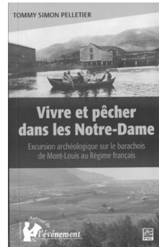
Tommy Simon Pelletier. Vivre et pêcher dans les Notre-Dame. Excursion archéologique sur le barachois de Mont-Louis au Régime français . Québec, Les Presses de l'Université Laval, 2014, 192 p.

« Une occupation euro-canadienne a pris place sur le barachois de Mont-Louis au cours du Régime français. » C'est l'hypothèse qui nous guide à travers les fouilles archéologiques, les documents d'archives et les récits oraux présentés dans ce livre. Ainsi, l'on y découvre les habitants du village de Mont-Louis, établissement permanent vivant de la pêche à la morue et l'un des premiers de la Gaspésie.