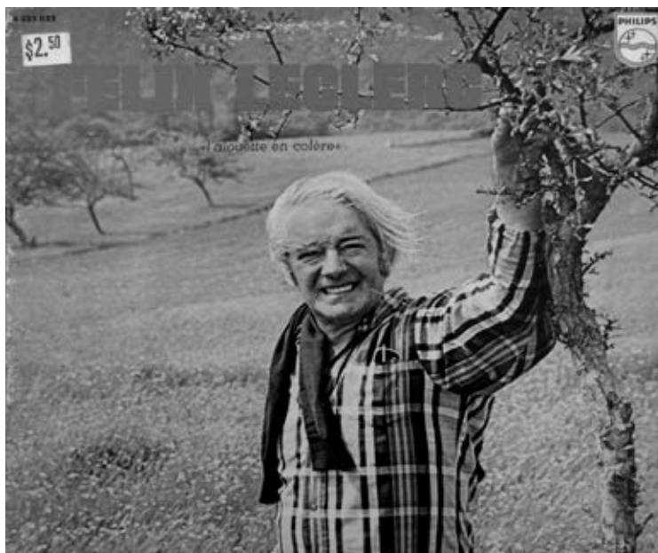
Félix Leclerc, 33 tours L'alouette en colère . Comprend des textes engagés comme « My neighbour is rich » et « Un soir de février », en plus de la chanson éponyme. Enregistré au Studio des Dames, à Paris. Accompagnement à la contrebasse de Léon Francioli (Philips, 6325 022, stéréo, distribué par London Records of Canada), 1972.

il acquiert la maison sise au 186, chemin de l'Anse à Vaudreuil, entre L'Anse-