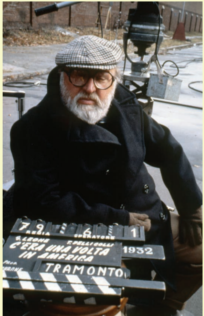
Sergio Leone lors du tournage de Once Upon a Time in America

et le point d’ancrage du récit 7 . » Et pour marquer le retour de l’antihéros dans son Ithaque de paradis artificiel au son de God Bless America (célèbre air d’Irving Berlin que l’on entendait en amorce hâtive du tout premier plan), le film se clôt sur un gros plan de son visage, vu à travers un voile qui en brouille les contours jusqu’à le rendre sans âge. Un visage désormais apaisé, arborant un large sourire, qui se fige dans une adresse à la caméra. Au terme d’un songe de presque quatre heures — mais qu’est-ce qu’un film, sinon une rêverie éveillée? —, Noodles, et par lui Leone, interpelle directement le spectateur pour lui confier le soin d’interpréter ce sourire, ce regard et ce film. L’exégèse chimérique est à n’en pas douter celle qui nous permet, à notre tour, de rêver mieux.