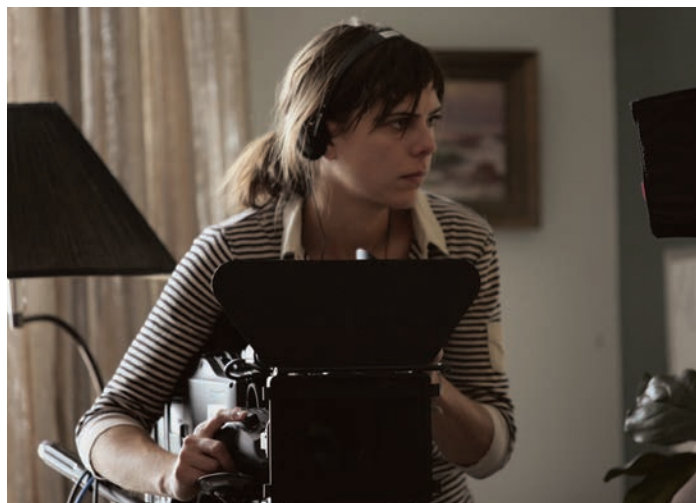
Sophie Deraspe à la caméra pour son film Les Signes vitaux