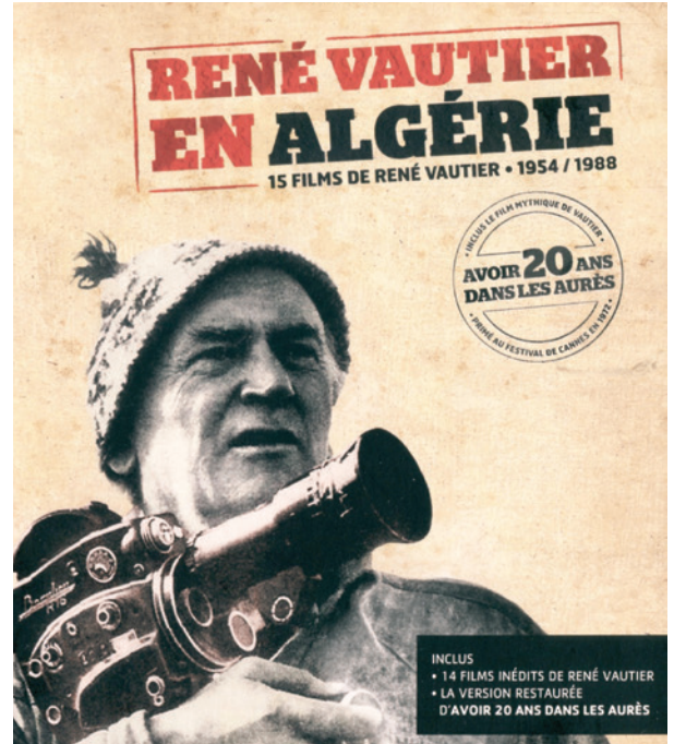
Image du film Avoir 20 ans dans les Aurès . Celui-ci fait parti d'un coffret de films de René Vautier proposé par la coopérative audiovisuelle Les Mutins de Pangée ( www.lesmutins.org ).

documentaire sera interdit pendant 40 ans, jusqu'à ce que, paradoxalement, le ministère des Affaires étrangères du gouvernement français souhaite en acheter les droits pour prouver aux anciens pays colonisés qu'un sentiment anticolonial existait en France dès les premières années d'après-guerre. Recherché par la police, Vautier tourne malgré tout Un homme est mort et sera ensuite envoyé dans une prison militaire en Allemagne, un comble pour un homme qui avait été décoré pour sa participation, jeune adolescent, à la Résistance française. Il n'en sortira qu'un an et demi plus tard, en 1952.