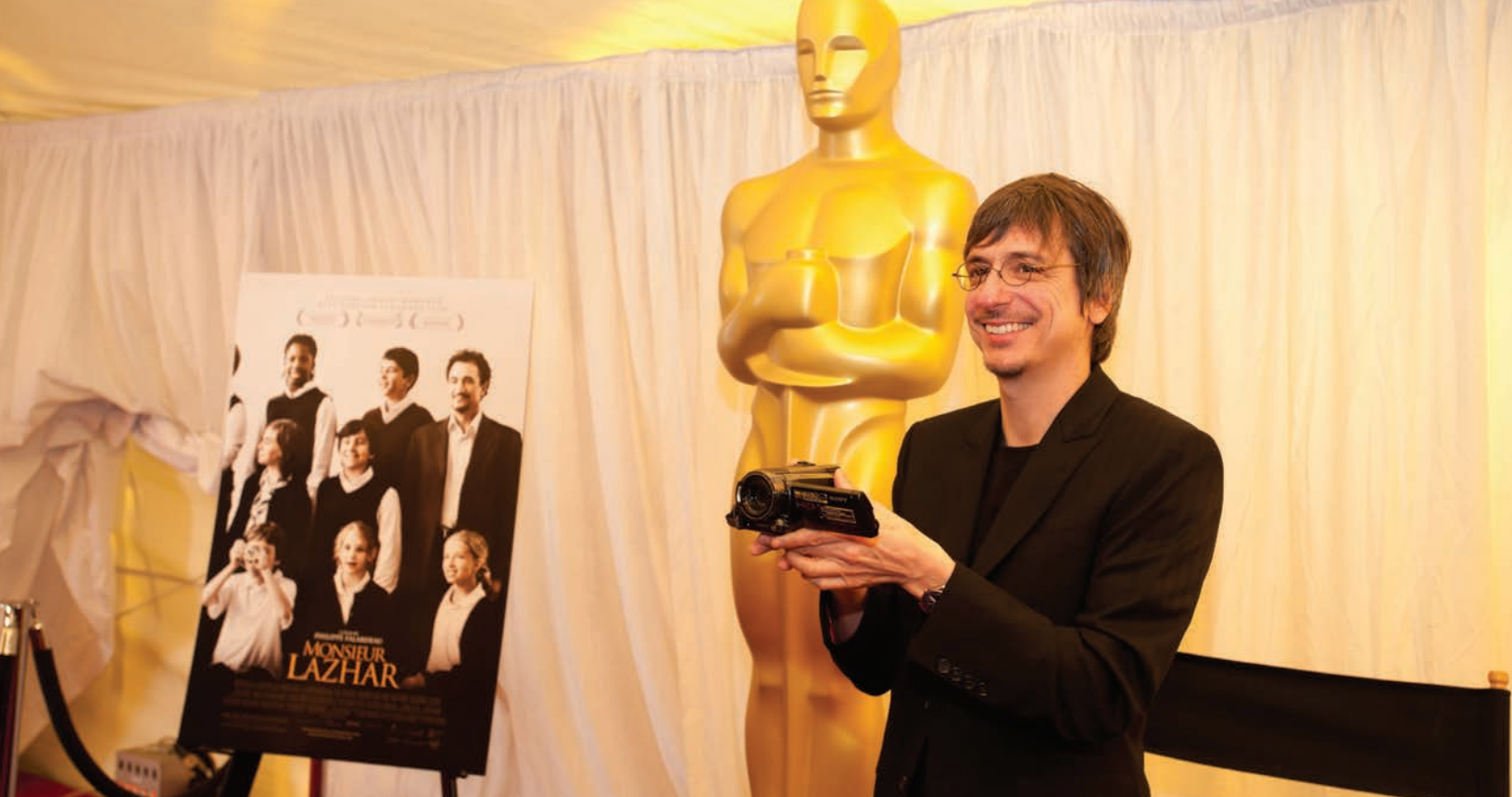
Philippe Falardeau aux Oscar en 2012 où Monsieur Lazhar était en lice dans la catégorie Meilleur film en langue étrangère

D'autres fois, je sens un frein à la création, oui — l'écriture en voyage est un mythe! Souvent, je vis le voyage en vrai touriste. Mais pour être honnête, je suis un peu au bout de l'aventure festivalière. Je viens de refuser des jurys entre autres en Russie, à Karlovy Vary et à Cluj, en Transylvanie. Je peux devenir désagréable dans un festival mal foutu ou mal organisé. Si c'est pour aller engueuler des gens pleins de bonnes intentions, je préfère rester à Montréal. »