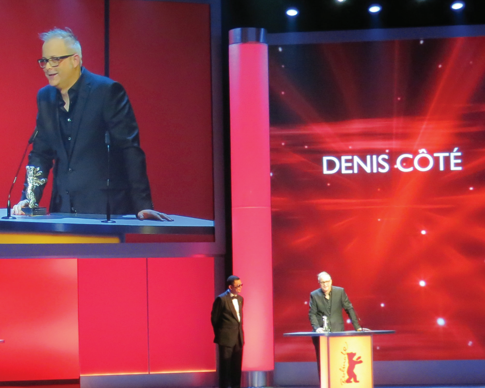
Denis Côté recevant le Prix Alfred-Bauer (Ours d'argent de l'innovation) des mains de Wong Kar-wai au Festival du film de Berlin en 2013 pour Vic et Flo ont vu un ours

pour tourner un court métrage; Anne Émond planchait sur le casting de son deuxième film, Les Êtres chers ; Bernard Émond était en plein tournage de sa septième fiction, Le Journal d'un vieil homme ; Philippe Falardeau prenait quelques jours de vacances bien mérités, entre la postproduction de The Good Lie , sa première incursion en sol américain, et une nouvelle version d'un scénario original, Guibord s'en va-t-en-guerre ; enfin, Stéphane Lafleur s'apprêtait à vivre son baptême cannois. Que ça. Et plus encore.