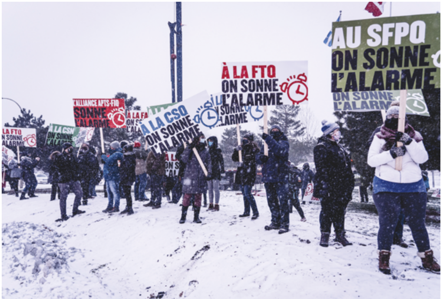
Des travailleurs et des travailleuses de différentes organisations syndicales ont participé en décembre 2020 à une action de visibilité, au pied du pont Jacques-Cartier à Montréal, pour sonner l'alarme à propos de la négociation du secteur public. Ils et elles réclament des offres concrètes pour résorber la crise qui sévit dans leurs milieux de travail depuis bien avant la pandémie.

vers le lieu de travail où se tiendraient les lignes de piquetage, comment respecter ce principe de solidarité intersyndicale en temps de grève? Voilà pour le moment une énigme qui nous fait d'autant plus regretter l'absence de front commun dans les négociations actuelles et qui, souhaitons-le, pourrait malgré tout être compensée par une coordination accrue des mandats de grève entre les différentes organisations.