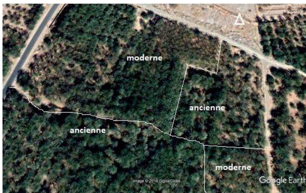
Palmeraie Mekhadma, Ouargla, 2018.