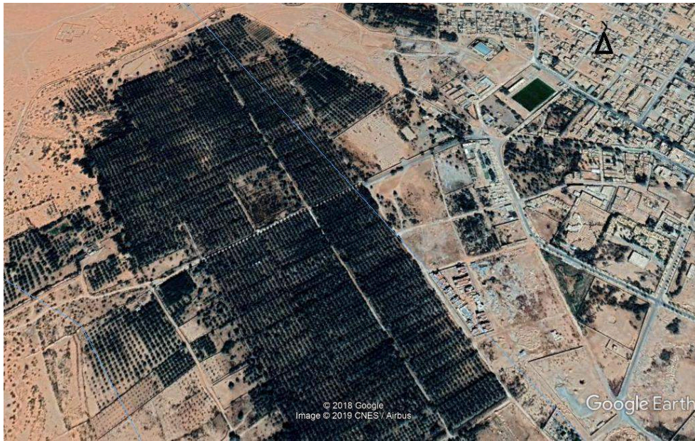
Palmeraie Hassi Ben Abdellah, Ouargla, 2018.