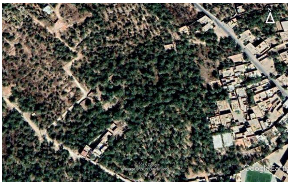
Palmeraie du ksar de Ouargla, 2018