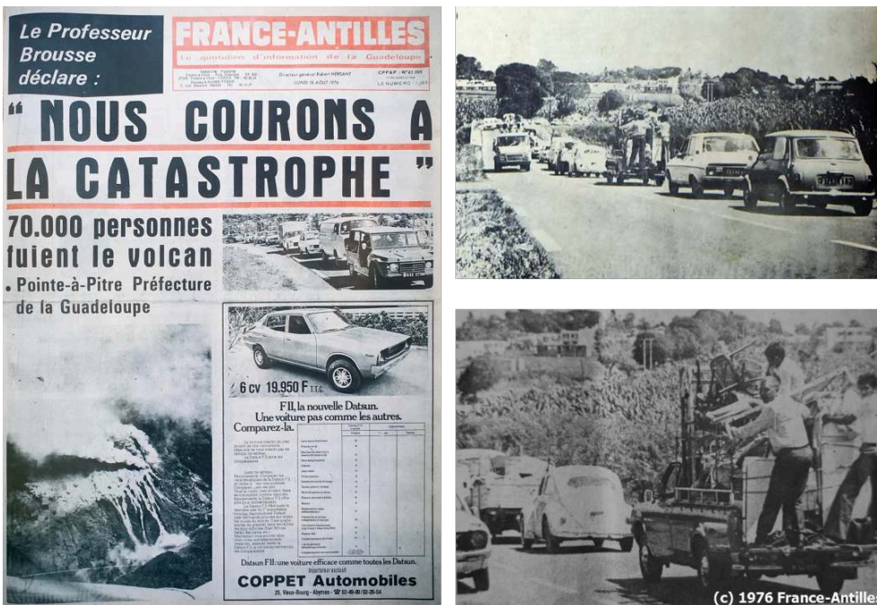
Figure 3. Une du France Antilles Guadeloupe du 16 août 1976 et photographies de l'évacuation du 15 août 1976 suite à la demande du préfet.