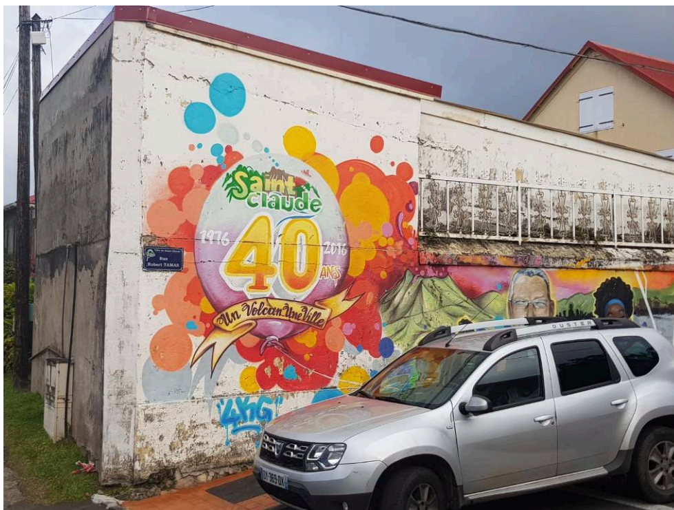
Figure 5. Fresque réalisée à Saint-Claude pour l'anniversaire des 40 ans, qui s'intitule « Saint-Claude, ville de volcan 1976-2016 ».