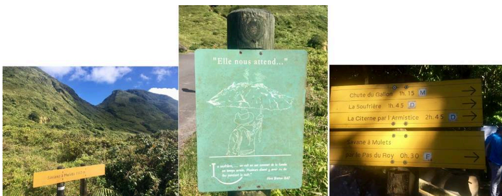
Figure 6. Exemples de panneaux le long du sentier de randonnée de la Soufrière.