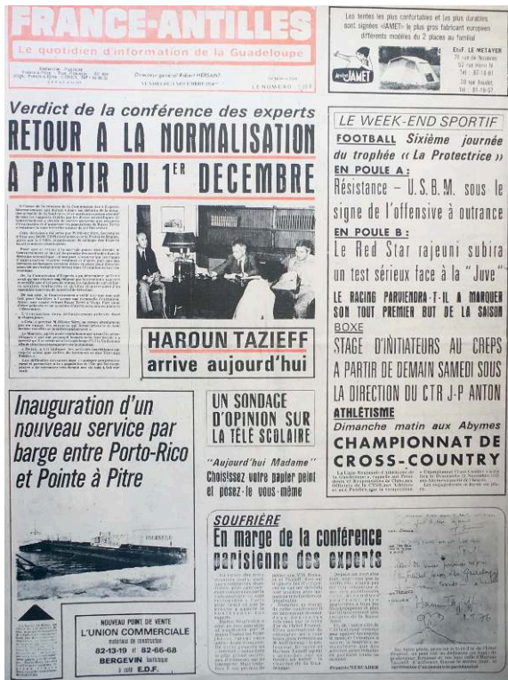
Figure 4. Une du France Antilles Guadeloupe du 19 novembre 1976.