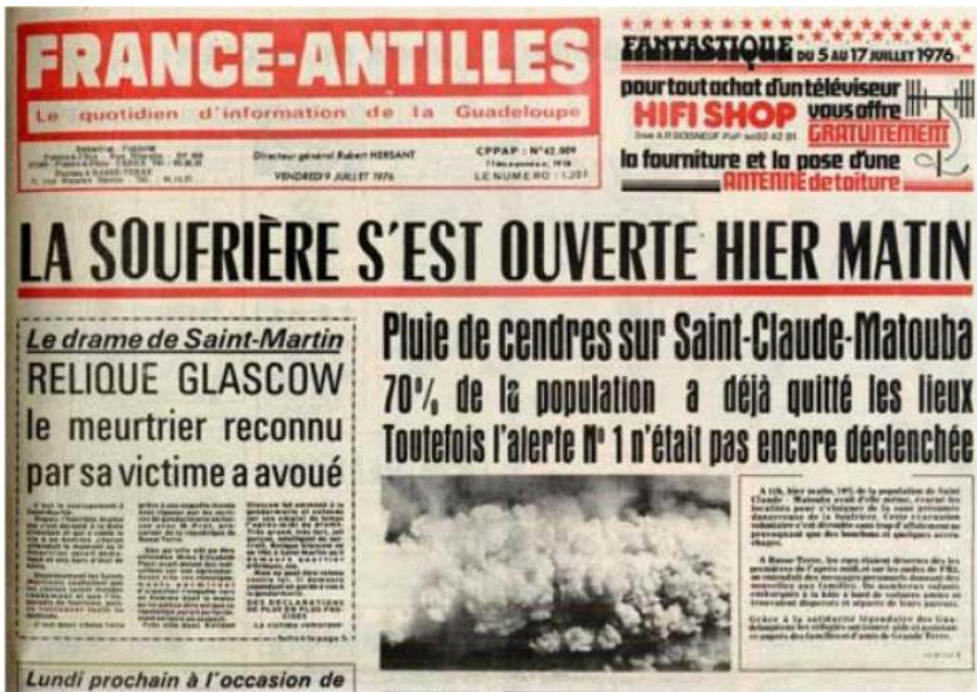
Figure 2. Une du France Antilles du 9 juillet 1976.