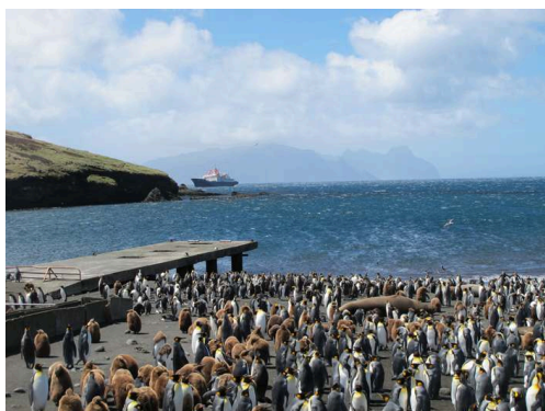
Figure 1. Une proximité quotidienne avec les animaux.