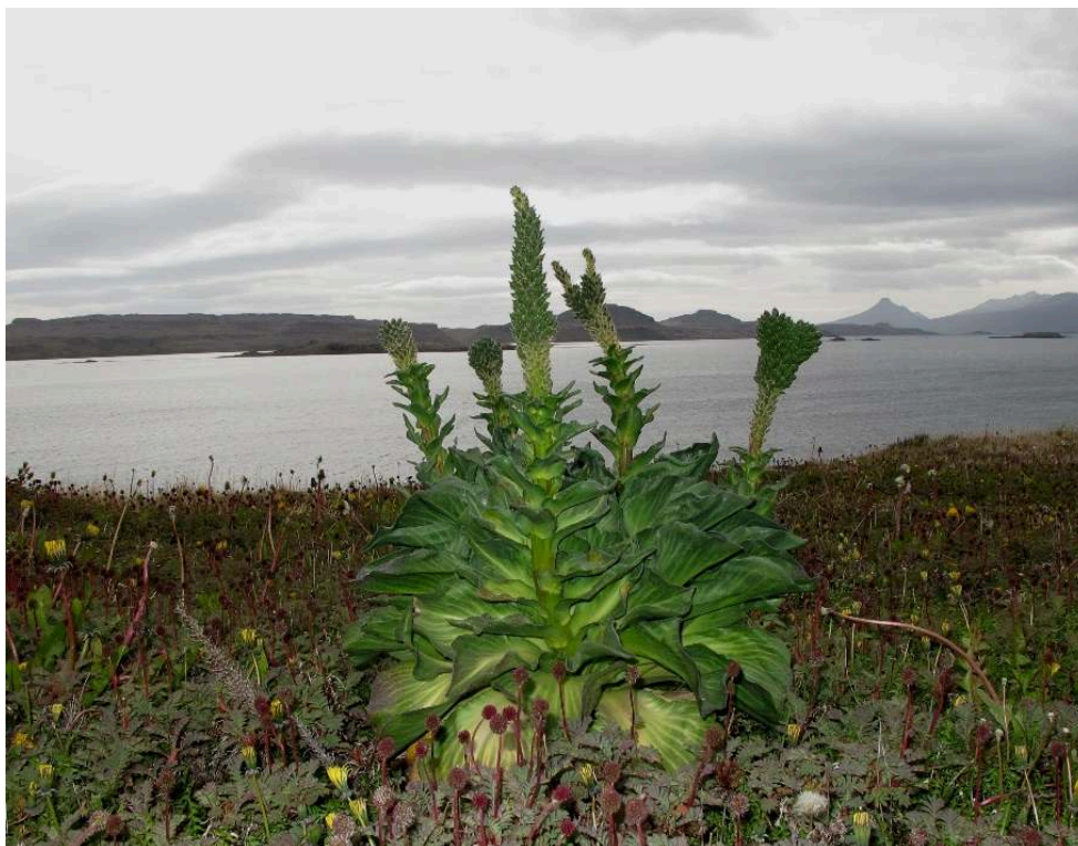
Pringlea antiscorbutica , ainsi nommée pour avoir sauvé les marins du scorbut. Atlan, 2016.