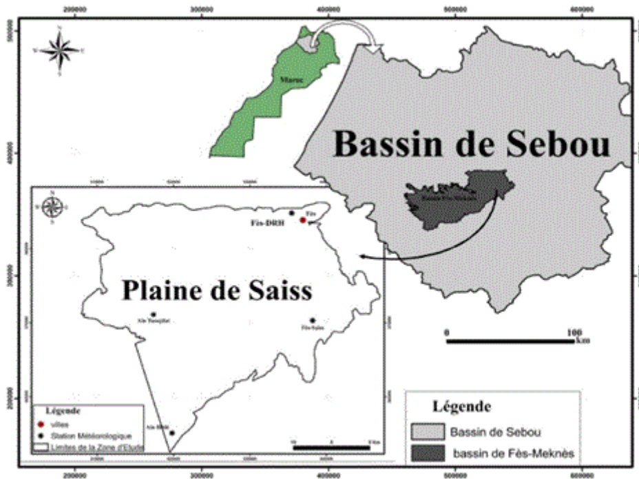
Figure 1. Situation géographique de la plaine de Saïss / Geographical location of the Saïss plain.