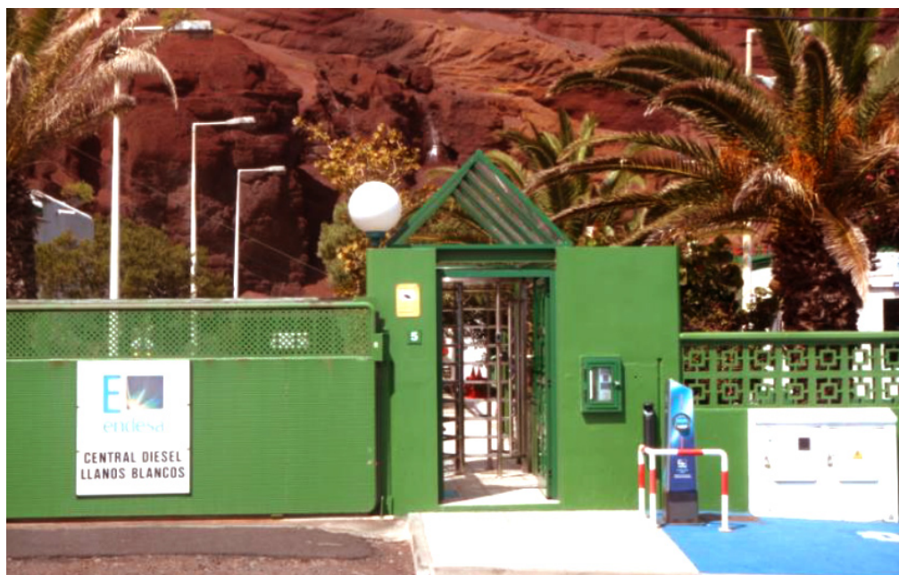
Figure 7. Le passé et le présent selon Endesa. Llanos Blancos, mars 2014.

Légende: à gauche, l'entrée de la station thermique au fioul d'El Hierro et, à droite, la borne de recharge rapide pour les véhicules électriques et leur emplacement.