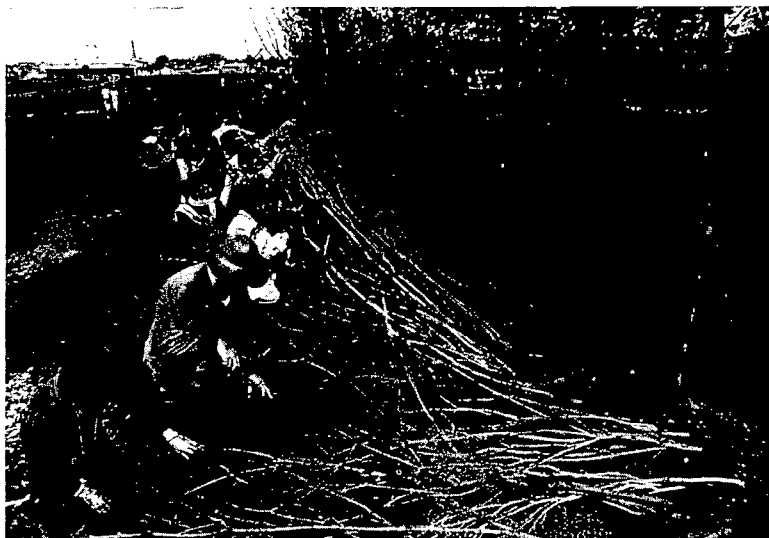
Installation conçue par Helen Escobedo, réalisée au Parc Beauséjour de Rimouski (juin 1987)