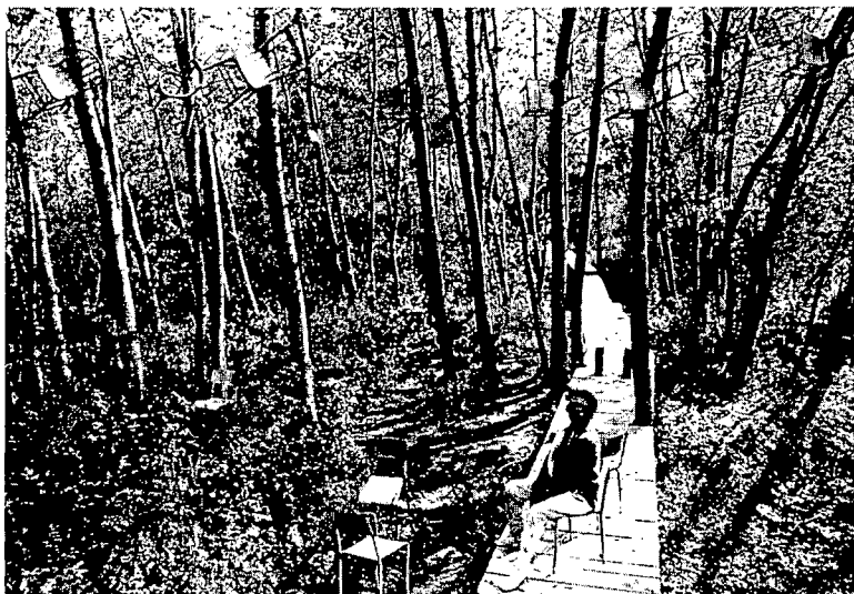
Installation conçue par Helen Escobedo (juin 1987)

Une partie de l'oeuvre réalisée au Parc Beauséjour... et son auteur.