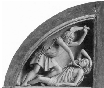
Jan van Eyck (v. 1385-1441), Le retable de l'Adoration de l'Agneau mystique, 1426-1432, cathédrale Saint-Bavon, Gand. Détail de la face intérieure du polyptyque: le Meurtre d'Abel.

Revenons à Alberti (1975; nous traduisons):