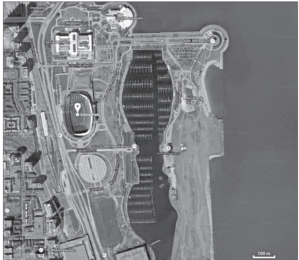
ILLUSTRATION 6 : Soldier Field, Chicago (États-Unis).