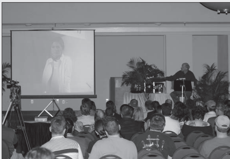
ILLUSTRATION 4 : Le scénariste, producteur et réalisateur de séries télévisées, Kenneth Johnson, commente un épisode de The Bionic Woman pour ses fans, lors d'un colloque.

Le colloque de fans n'est donc pas que l'affaire d'un fanatisme extrême ; il est aussi, et surtout, celle de la reconnaissance.