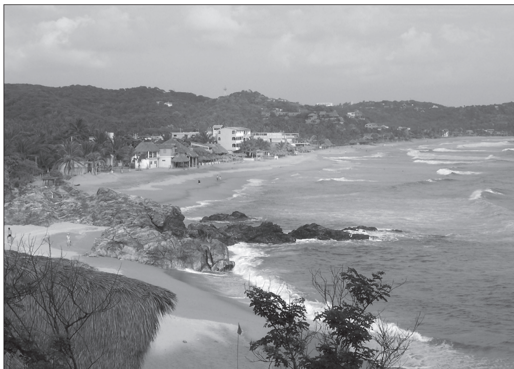
ILLUSTRATION 1 : Vue générale de la plage de Zipolite en direction de l'Est (photo : Juan Carlos Monterrubio).

L'enquête a été menée sur la plage nudiste de Zipolite (illustration 1 1 ), située dans une région rurale de la côte pacifique du Mexique, dans l'État d'Oaxaca, à 540 km à l'est d'Acapulco et à 60 km à l'ouest de Puerto Escondido. Cette dernière station est une destination internationale réputée pour ses compétitions de surf. Zipolite est également facilement accessible depuis l'aéroport de Huatulco, distant de la station de moins de 50 km, et qui permet l'arrivée d'une clientèle étrangère transitant par Mexico ou de résidents de l'agglomération capitale. Zipolite est réputée dans le pays pour être la plage publique la plus importante du Mexique en termes de fréquentation par des nudistes (Brenner et Fricke, 2007). Signe de sa notoriété, elle est répertoriée jusque dans un guide touristique généraliste comme le Guide vert Michelin (2001 : 277). Le nudisme y est développé sans autorisation officielle, simplement par une tolérance de facto . Contrairement aux pays d'Amérique du Nord et aussi à certains pays d'Amérique Centrale (République Dominicaine, Cuba, Jamaïque, Panama), le Mexique ne dispose d'aucune plage où le nudisme