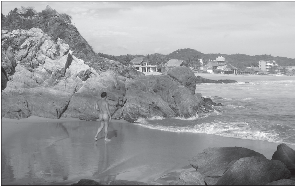
ILLUSTRATION 3 : Nudiste sur la plage de Zipolite.