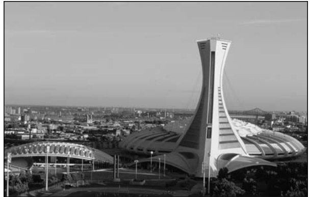
Illustration 1 : Stade olympique de Montréal.

Original sur le plan architectural, le complexe olympique laisse en héritage une dette publique nécessitant plusieurs décennies de remboursement. Il a été dès son origine et reste encore le projet le plus controversé de la ville. Le stade, qui peut accueillir 56 000 personnes assises, a de la difficulté à trouver un tel public et est utilisé pour des concerts de rock, des opéras, des manifestations