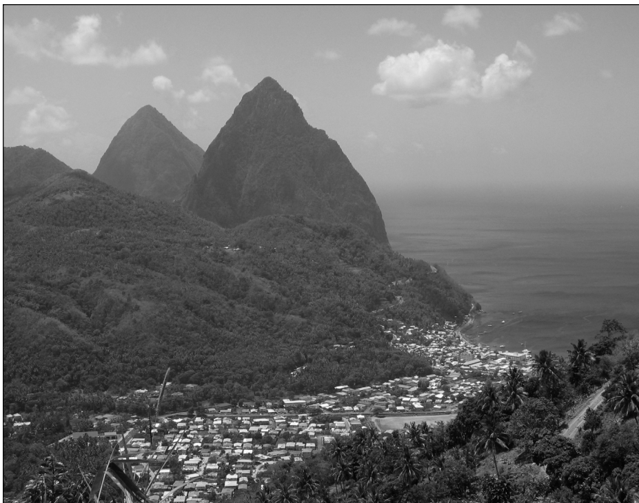
Panorama dominant le Baie de Marigot (Sainte-Lucie).

Sur le plan architectural, les variables expliquées sont regroupées en trois blocs, tel que montré à la figure 1 : d'abord les variables de