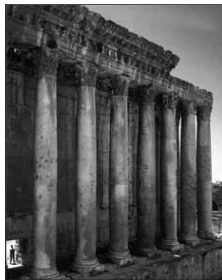
Le temple de Bacchus à Baalbek (Liban).

Ce dynamisme des services de l'État et du secteur privé ont assuré, de 1968 à 1974, un essor remarquable au secteur touristique ; ses revenus se sont multipliés par quatre, jusqu'à constituer 10 % du produit intérieur brut (PIB) (Owen, 1993 : 25-37), l'afflux des villégiateurs du Golfe y ayant largement contribué. À la veille de la guerre civile, le secteur touristique était consi-