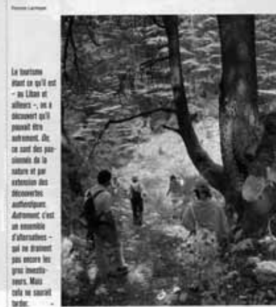
Randonnée dans la forêt libanaise.