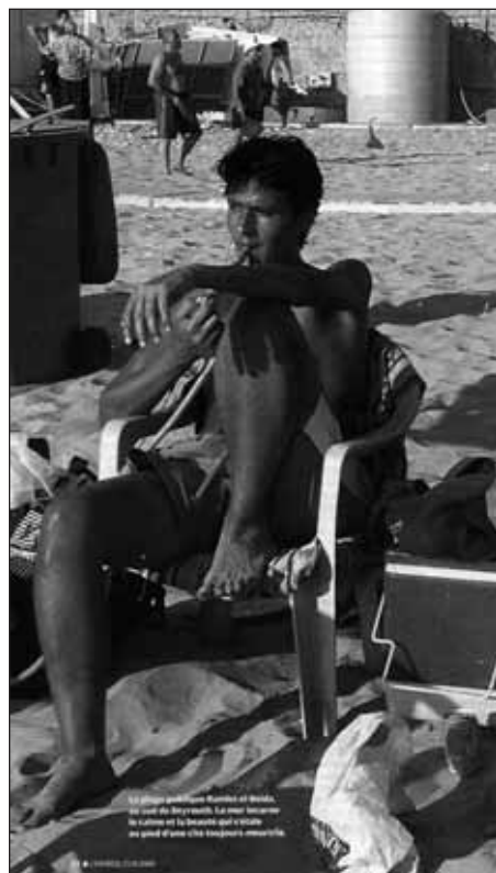
Un Libanais à la plage.

Le tourisme balnéaire résidentiel (complexes touristiques balnéaires) se développe pendant la guerre civile. Les promoteurs immobiliers, toujours à l'affût d'un créneau lucratif, répondent rapidement à une forte demande de la part d'une population fuyant la capitale et les bombar-