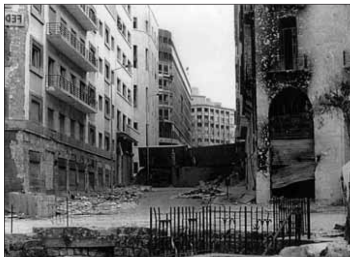
La place du Parlement pendant la guerre civile. Photo : Trawi, 2001.

Le ministère du Tourisme aspire à ce que le Liban retrouve très vite sa place sur les marchés touristiques régionaux 17 et internationaux. Mais il est conscient aussi que, à l'aube du XXI e siècle, développer le secteur touristique exige un travail de prévision et de planification. Il entreprend donc dès 1993, en collaboration avec l'Organisation mondiale du tourisme (OMT) 18 , l'élaboration d'un Plan directeur de développement et de reconstruction touristique financé par le Programme des Nations unies pour le développement (PNUD), le gouvernement français et le gouvernement libanais.