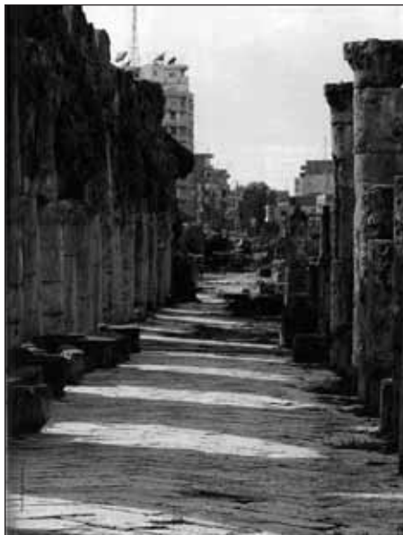
La colonnade de Tyr (Liban Sud).

Le Liban, autrefois si créatif et dynamique dans ses campagnes publicitaires, semble en avoir perdu le « feeling ». Le ministère du Tourisme du Liban, en accord avec le gouvernement français, avait mené, à la fin des années 1990, une campagne d'affichage dans les métros à Paris. En 2004, plusieurs clips vantant les multiples qualités du Liban passaient quotidiennement en boucle sur la chaîne américaine CNN. Ces opérations certainement coûteuses n'auront jamais le même impact que la diffusion, en Europe aux États-Unis, au Japon... d'articles dans lesquels le Liban est à l'honneur. Car c'est en entrant dans l'intimité des ménages, par la lecture de revues, de magazines, de quotidiens à grand tirage..., que l'on peut vendre du rêve et inciter au départ.