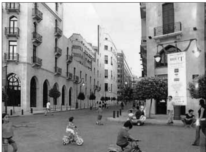
La place du Parlement restaurée. Photo : Trawi, 2001.