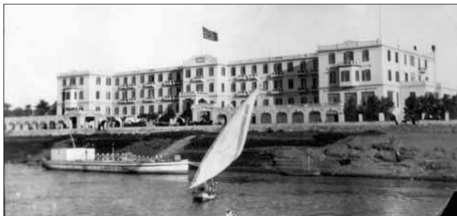
L'hôtel Winter Palace, inauguré en 1907.

S'y pratiquent toutes sortes d'activités qui paraissent pour le coup incongrues pour le lieu et en révèlent la forte urbanité : chapeliers, prostituées, tailleurs à l'euro-péenne, photographe ou encore un réparateur de piano.