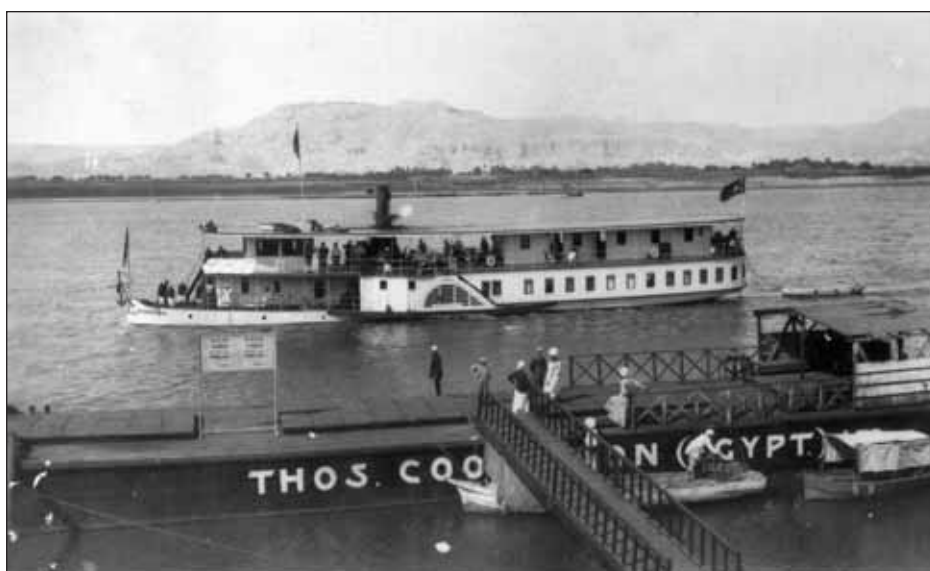
Embarcadère de l'agence Thomas Cook & Son à Louxor (Égypte).

La diffusion des connaissances sur l'Orient contribue notamment à la diversification des candidats au voyage (Berchet, 1985 ; Rauch, 2000). Elle passe notamment par la publication d'ouvrages d'un genre nouveau où l'on trouve à la fois de l'information historique et culturelle et des conseils pratiques. L'invention du guide touristique est un élément déterminant des transformations pratiques du voyage, à la fois portée par une demande touristique croissante et un souci de vulgariser des savoirs jusque-là réservés aux initiés. Jusque dans les années 1870, le guide touristique sur l'Égypte reste d'un genre littéraire et élitiste, à l'instar du Riffaud , paru en 1830. « L'apparition d'un étranger est