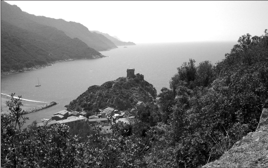
Une dimension de l'accessibilité à l'écotourisme : le rapport nature / culture. La ville de Porto en Corse.

hôtel, résidence privée et autres) ainsi que sur les principales motivations (attirait pour la nature, les lacs et les rivières, les montagnes, les parcs, le bord de la mer, la rencontre de personnes qui partagent les mêmes intérêts...) (Eagles, 1992).