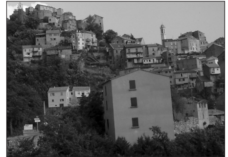
La ville de Corte en Corse.

Enfin, une expérience écotouristique ne peut être globale sans être à la fois d'une haute intensité d'ensemble où les attentes sont celles d'un enrichissement à la fois esthétique, écologique, culturel et humain. La perception d'une intensité qui correspond à l'expression anglaise de sentient experience , soit une expérience apprise par les sens. Plus cette expérience permet le « dépaysement », la recherche d'un « ailleurs », de « l'inconnu », d'une