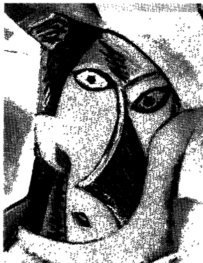
Fig. 4. Pablo Picasso, les Demoiselles d'Avignon (détail).