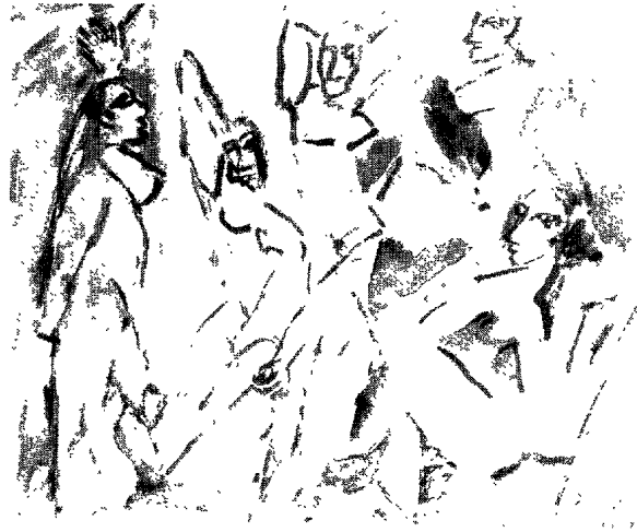
Fig. 9. Pablo Picasso, Cinq nus (étude pour les Demoiselles d'Avignon ), 1907. Aquarelle (17 x 22 cm), Philadelphia Museum of Art.

de masques africains que nous leur connaissons aujourd'hui. Cela met le point final à l'exécution du projet. Qu'est-il arrivé entre temps ?