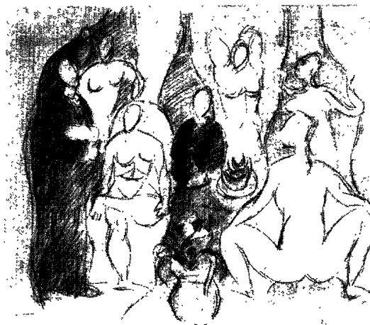
Fig. 8. Pablo Picasso, Étudiant en médecine, marin et cinq nus dans un bordel (étude pour les Femmes d'Alger ), 1907. Fusain et pastel (48 x 63 cm). Kunstmuseum Basel, Kupferstichkabinett, Öffentliche Kunstsammlung Basel.