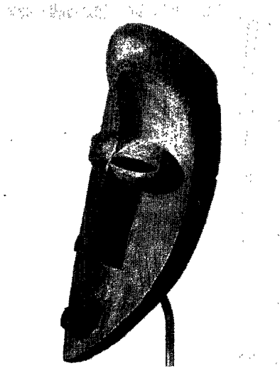
Fig. 3. Masque étoumbi (35 cm). Genève, Musée Barbier-Müller. Acquis par A. Courtoir vers 1930.