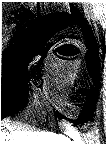
Fig. 6. Pablo Picasso, les Demoiselles d'Avignon (détail).