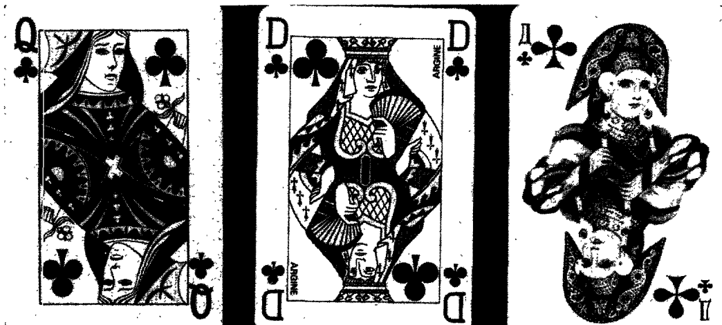
Fig. 11. Cartes à jouer modernes : russe, française, américaine.