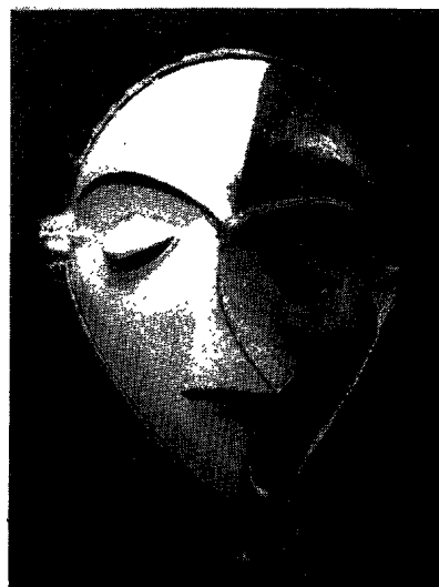
Fig. 5. Masque pende (26 cm), Tervuren, Belgique, Musée Royal de l'Afrique Centrale.