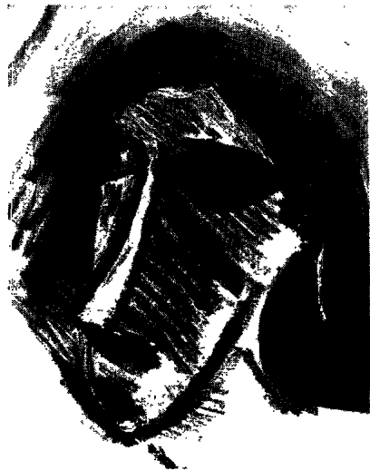
Fig. 2. Pablo Picasso, les Demoiselles d'Avignon (détail).

À droite, en haut, la tête (fig. 2) s'apparente à un masque étoumbi de la République du Congo (fig. 3), et en bas (fig. 4) à un masque de maladie pende du Zaïre (fig. 5). À gauche, la tête (fig. 6) est de même forme que celle d'un masque dan (fig. 7) de la société secrète du poro (Liberia et Côte-d'Ivoire).