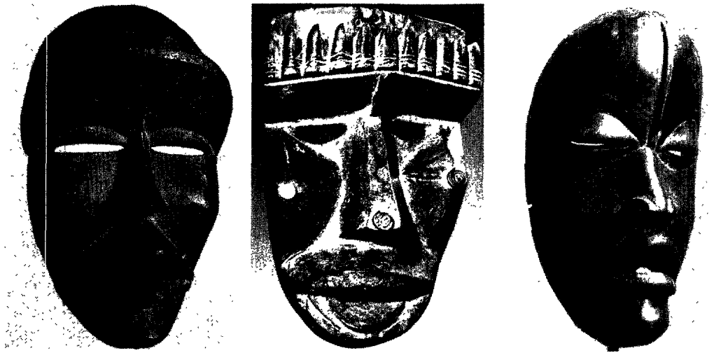
Fig. 10. Masques dan : variations sur un même thème. New York, Metropolitan Museum of Art; Paris, Musée de l'homme; collection particulière.